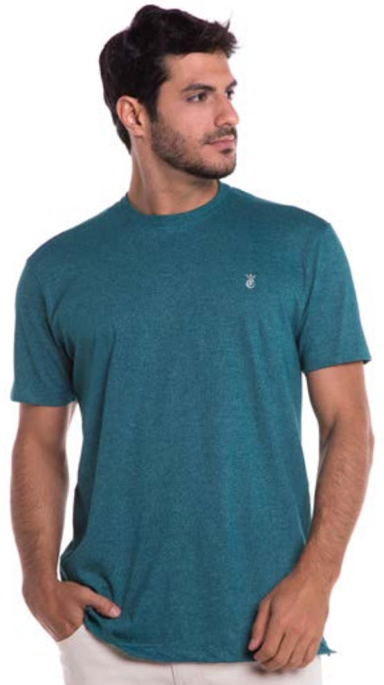
REF. 1225 CAMISETA //////////////////// Sensation Tradicional 62% Alg. 38% Pol. Tam. P ao S8