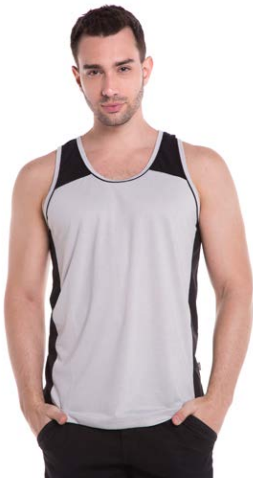
REF. 4413 CAMISETA REGATA /////////////////////////////////////////////////////////////////// Street 65% Pol. 35% Visc. Tam. P ao S8