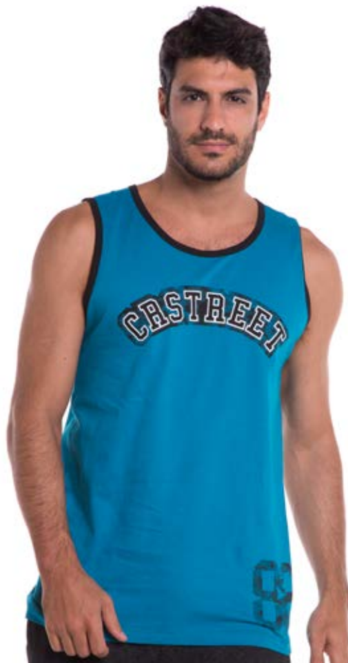
REF. 4441 CAMISETA REGATA /////////////////////////////////////////////////////////////////// Street 100% Algodão Tam. P ao GG