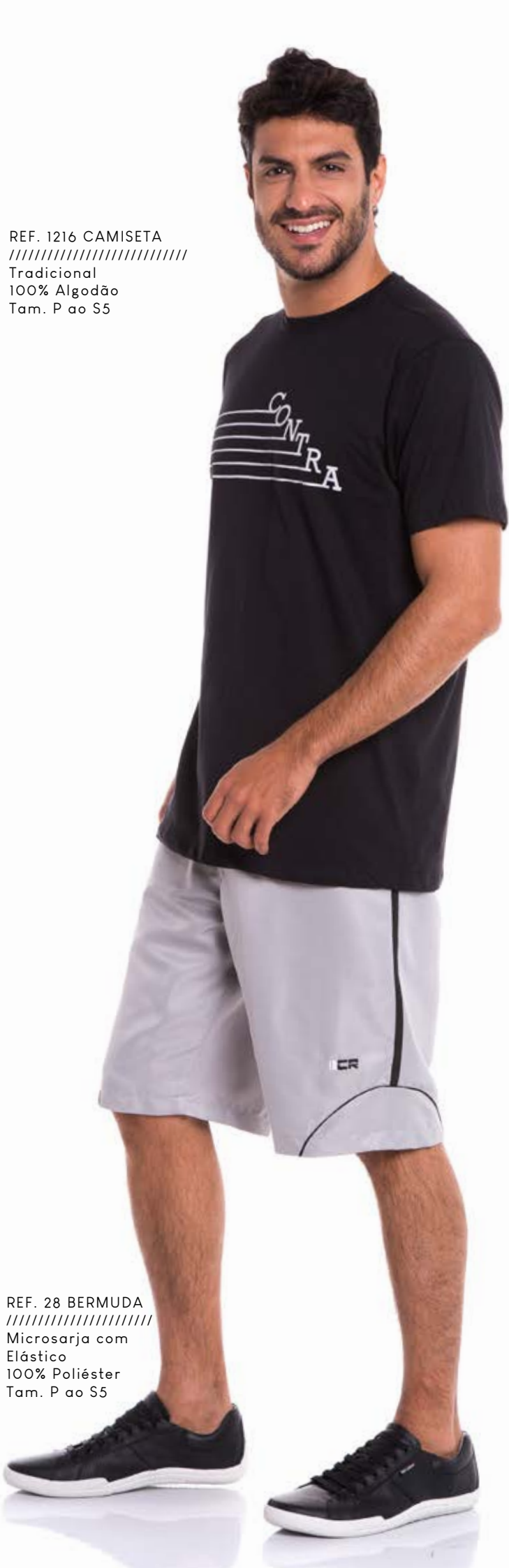
REF. 1216 CAMISETA //////////////////// Tradicional 100% Algodão Tam. P ao S5