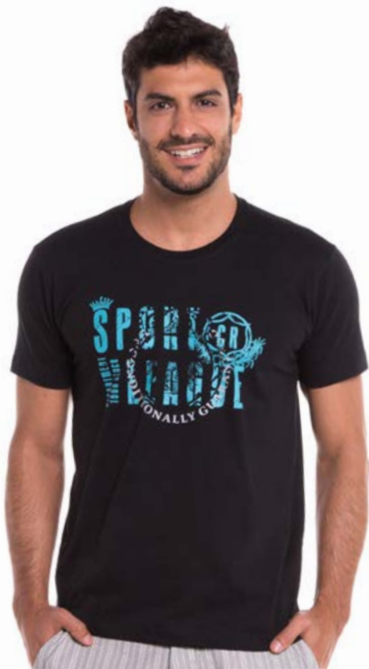
REF. 1228 CAMISETA //////////////////// Street 100% Algodão Tam. P ao GG