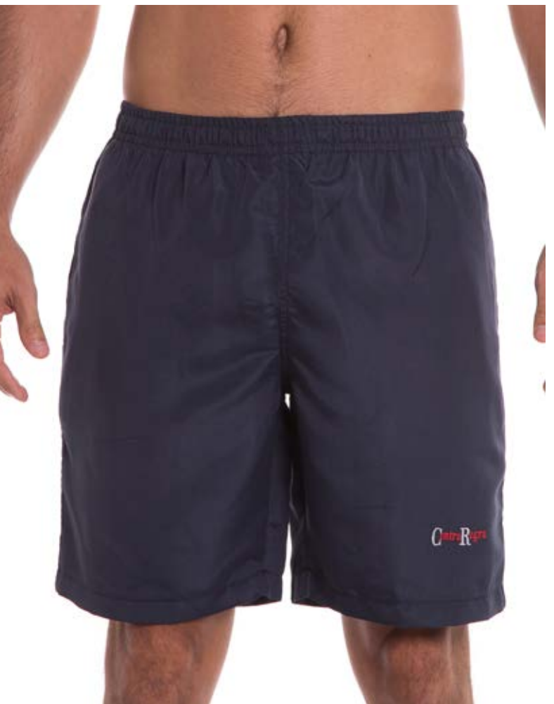
REF. 62 BERMUDA //////////////////// Microfibra com Elástico 100% Poliéster Tam. 2 ao S8