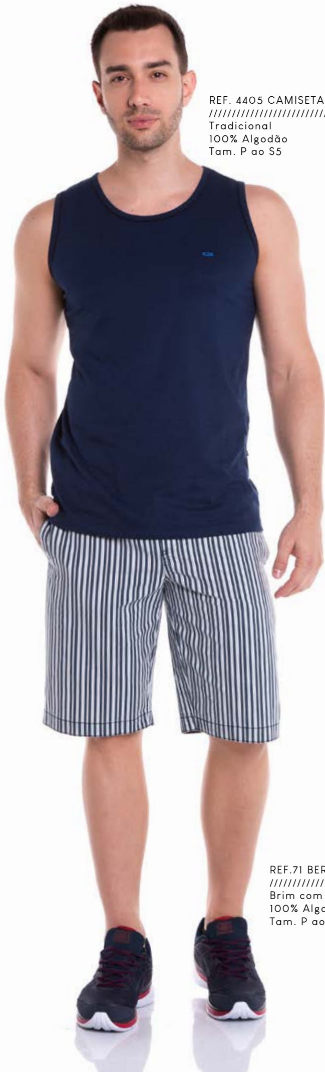
REF. 4405 CAMISETA REGATA //////////////////// Tradicional 100% Algodão Tam. P ao S5