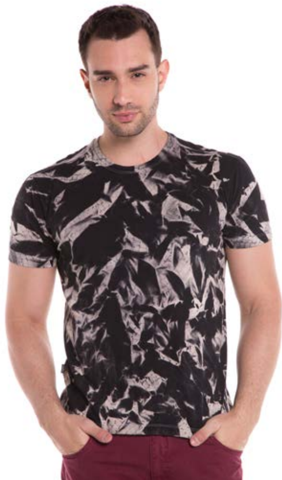
REF. 1223 CAMISETA //////////////////// Street 100% Algodão Tam. P ao GG