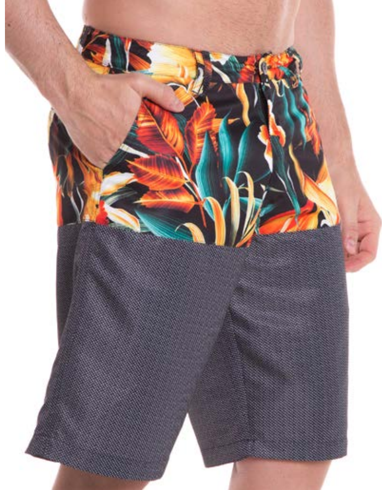
REF. 12 BERMUDA //////////////////// Cós Sublimada Microsarja 100% Poliéster Tam. 36 ao 48.