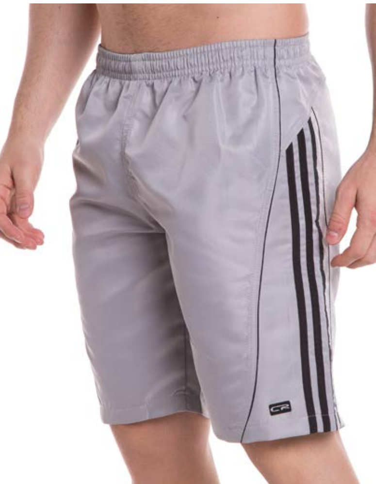
REF. 557 BERMUDA //////////////////// Microsarja com Elástico 100% Poliéster Tam. P ao S8