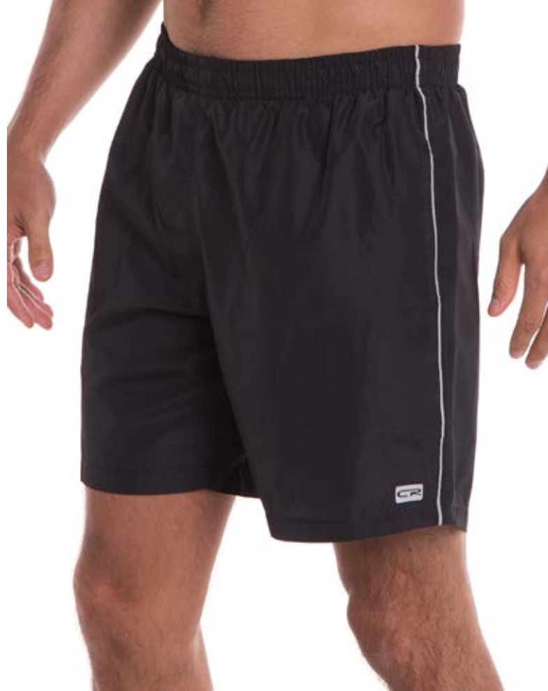
REF. 76 BERMUDA MAIS CURTA //////////////////// Microfibra com Elástico 100% Poliéster Tam. 2 ao S8