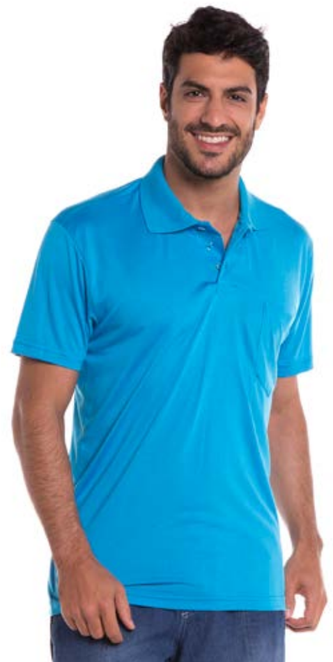
REF. 3449 CAMISETA //////////////////// Polo Tradicional 65% Alg. 35% Visc. Tam. P ao S5