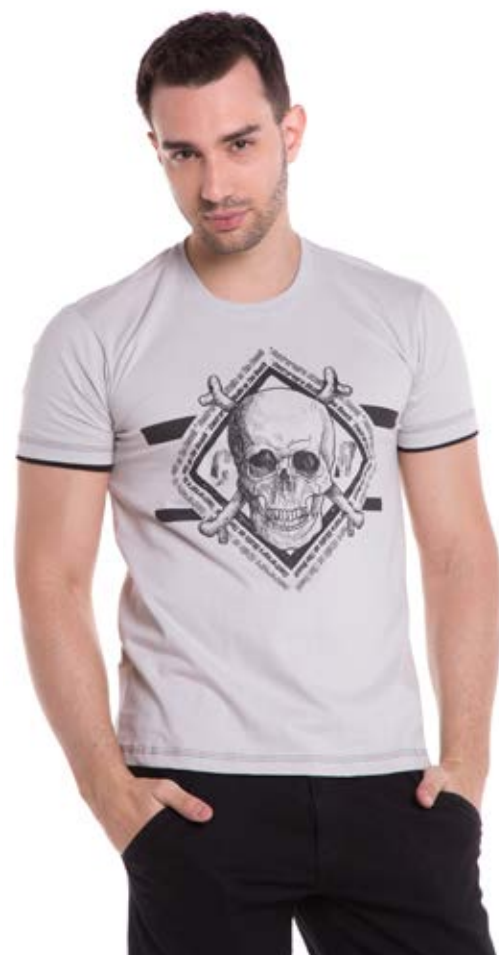
REF.1227 CAMISETA //////////////////// Street 100% Algodão Tam. P ao GG