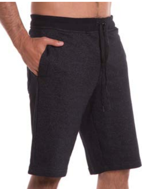
REF. 13 BERMUDA Moletom Sensation com Elástico 17,7% Pol. 82,3% Algodão Tam. P ao S5