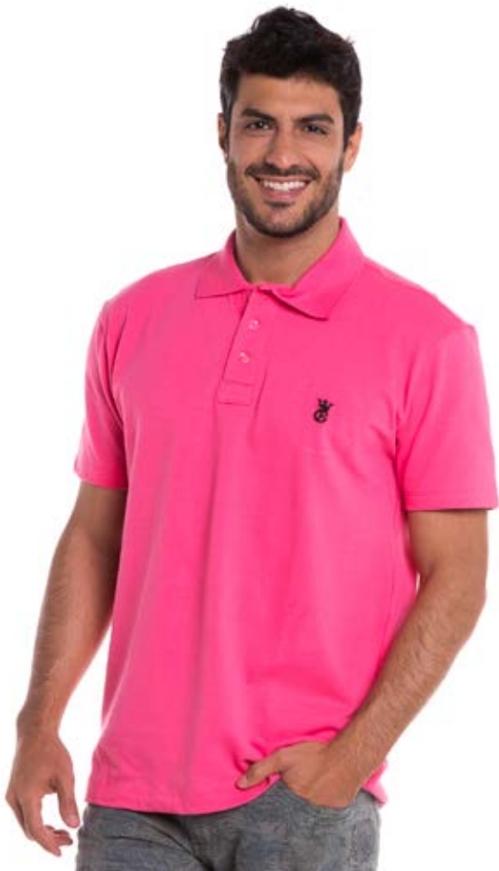
REF.3483 CAMISETA //////////////////// Polo Tradicional 98% Alg. 2% Elast. Tam. P ao S5