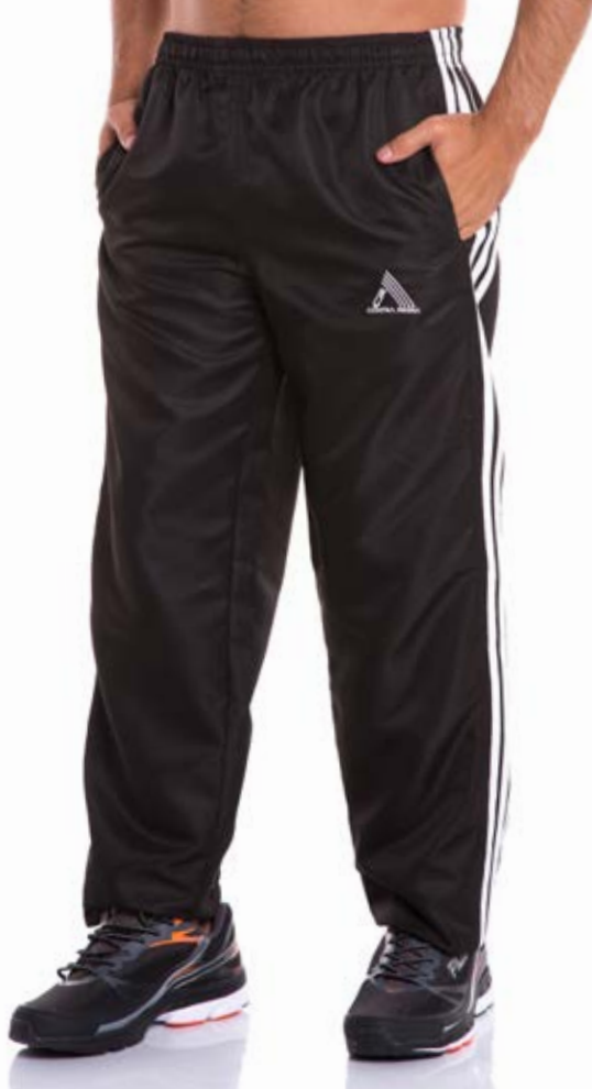
REF. 221 CALÇA //////////////////// Microsarja com Elástico 100%Poliéster Tam. 4 ao S5