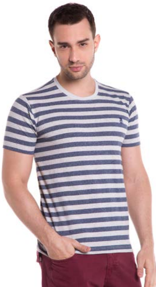
REF. 1230 CAMISETA //////////////////// Street Listrado 69% Alg. 27% Pol. 4% Elast. Tam.P ao GG