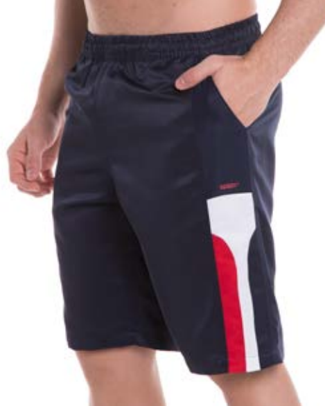
REF. 756 BERMUDA /////////////////////////////////// Microsarja de Elástico 100% Poliéster Tam. P ao S5