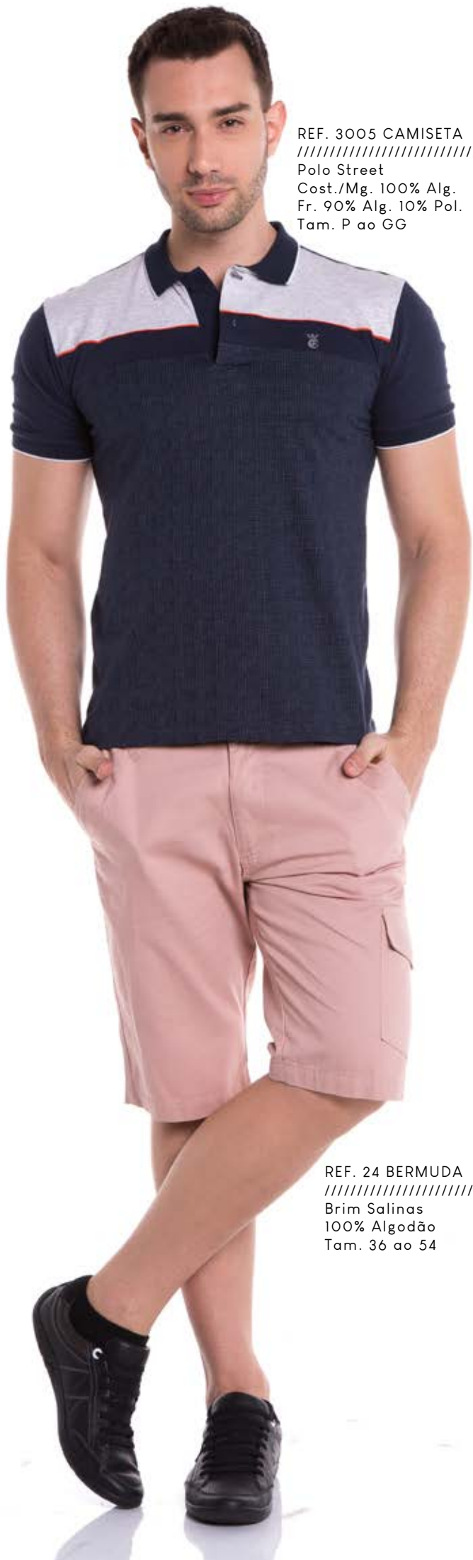
REF. 3005 CAMISETA //////////////////// Polo Street Cost./Mg. 100% Alg. Fr. 90% Alg. 10% Pol. Tam. P ao GG