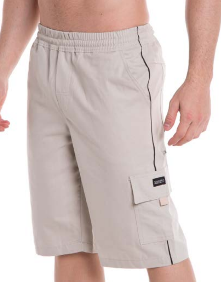
REF. 98 BERMUDA //////////////////// Brim com Elástico 100% Algodão Tam. P ao S5