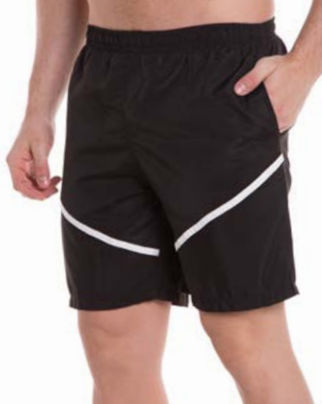
REF. 94 BERMUDA MAIS CURTA /////////////////////////////////// Microfibra com Elástico 100% Poliéster Tam. P ao S4