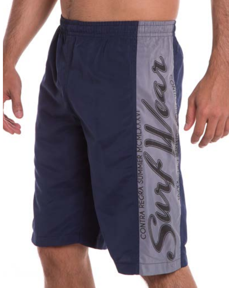
REF. 14 BERMUDA //////////////////// Microfibra com Elástico 100% Poliéster Tam. 2 ao GG