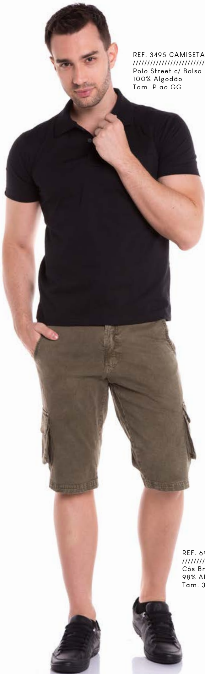
REF. 3495 CAMISETA //////////////////// Polo Street c/ Bolso 100% Algodão Tam. P ao GG