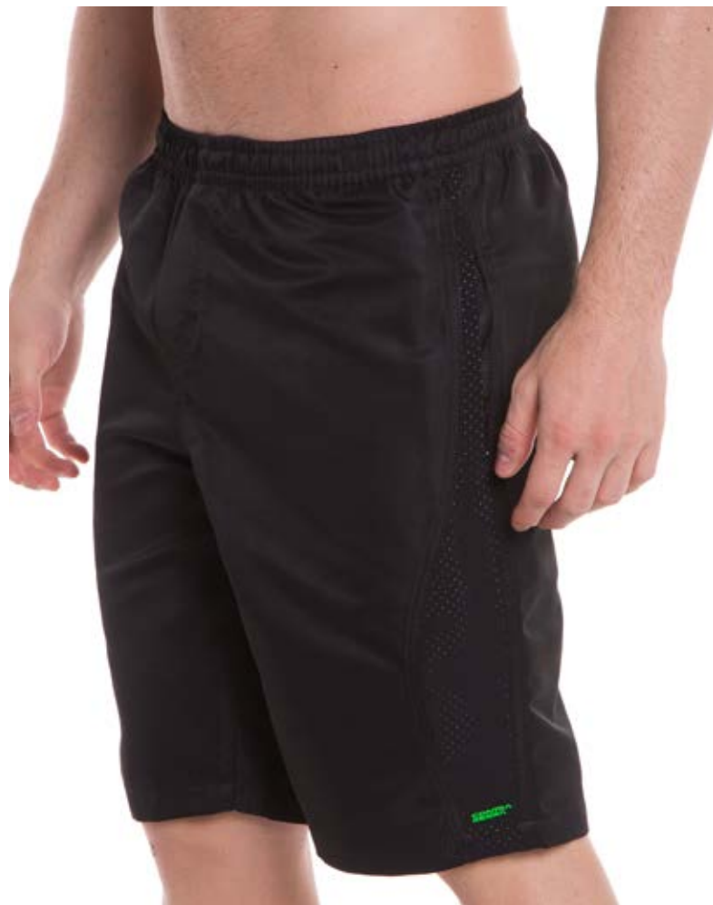
REF. 720 BERMUDA //////////////////// Microsarja com Elástico 100% Poliéster Tam. P ao S8