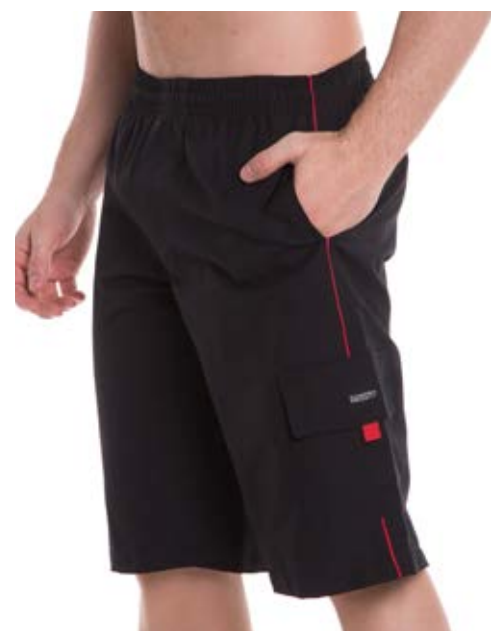
REF. 25 BERMUDA /////////////////////////////////// Nytom de Elástico 25% Pol. 75% Alg. Tam. P ao S5