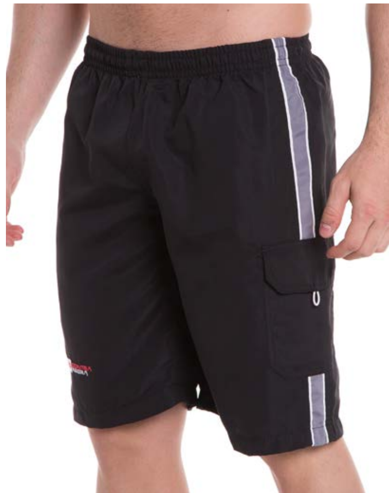
REF. 57 BERMUDA //////////////////// Microfibra com Elástico 100% Poliéster Tam. 2 ao S5