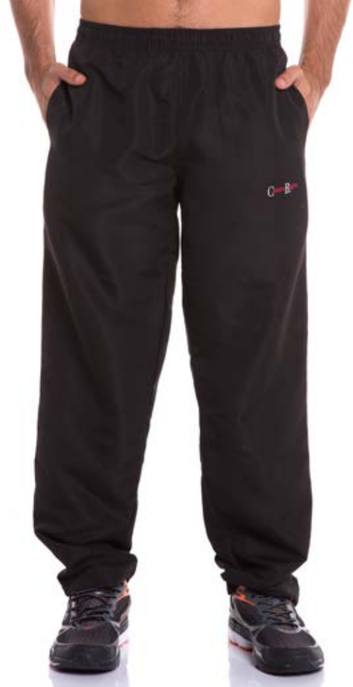
REF. 163 CALÇA //////////////////// Microfibra com Elástico 100%Poliéster Tam. 2 ao S8