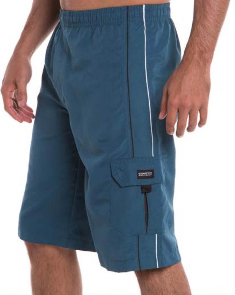
REF. 33 BERMUDA //////////////////// Microfibra com elástico 100% Poliéster Tam. 2 ao S5