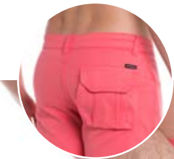
REF. 739 BERMUDA //////////////////// Cós Brim Adelina 98% Alg. 2% Elast. Tam. 36 ao 52