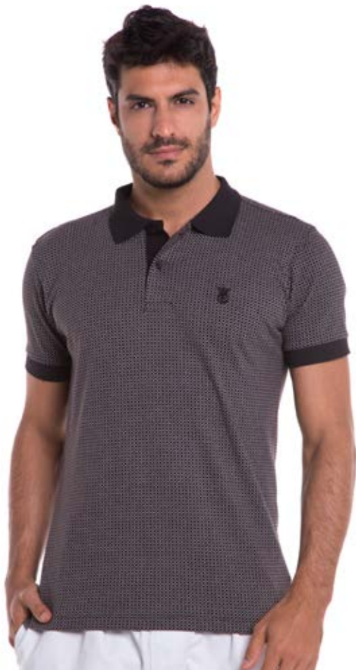
REF. 3812 CAMISETA //////////////////// Ultrasoft Polo street 100% Algodão Tam. P ao GG