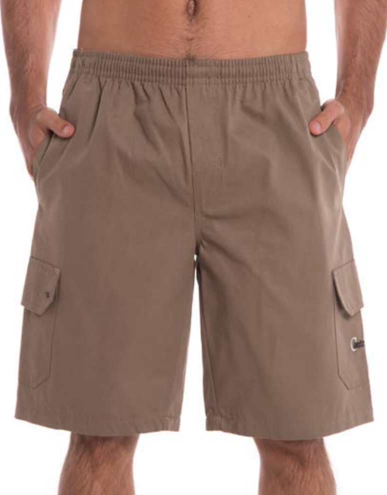
REF. 91 BERMUDA //////////////////// Brim com Elástico 100% Algodão Tam. P ao S8