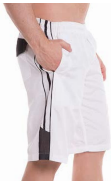
REF. 31 BEMUDA /////////////////////////////////// Elástico Microsarja 100% Poliéster Tam. P ao S5