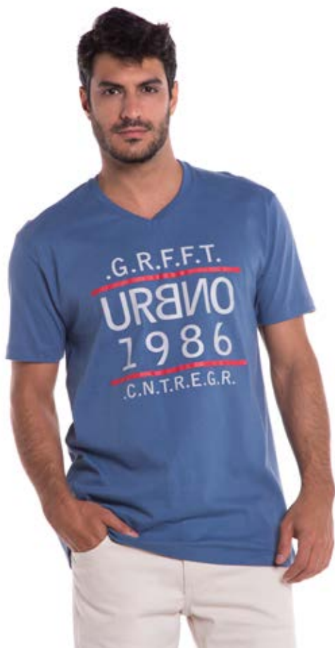
REF. 1169 CAMISETA /////////////////////////////////////////////////////////////////// Tradicional 100% Algodão Tam. P ao S5