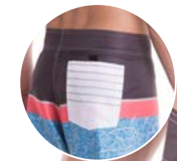
REF. 49 BERMUDA //////////////////// Cós Microsarja Sublimada 100% Poliéster Tam.36 ao 52