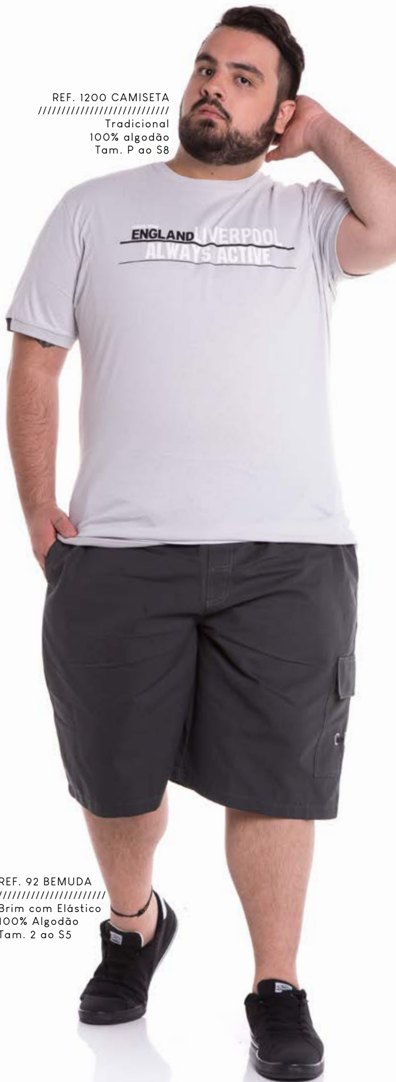
REF. 92 BERMUDA //////////////////// Brim com Elástico 100% Algodão Tam. 2 ao S5