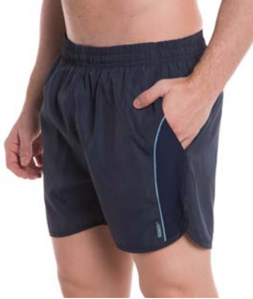
REF. 17 SHORTS Exim de Elástico 100%Poliéster Tam. P ao GG