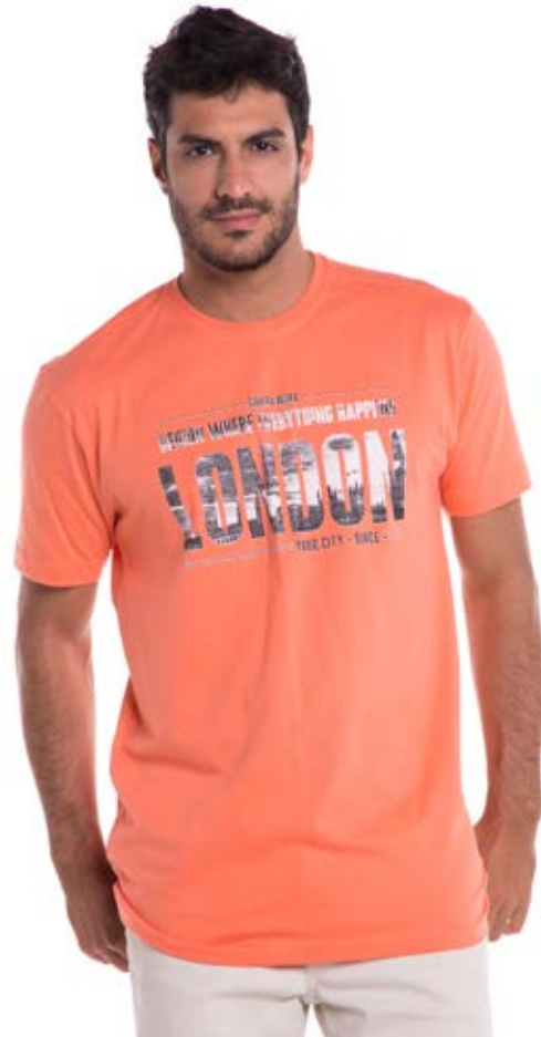
REF. 1226 CAMISETA //////////////////// Tradicional 100% Algodão Tam. P ao S8