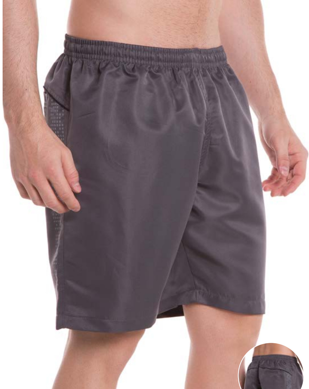
REF. 08 BERMUDA MAIS CURTA //////////////////// Microsarja com Elástico 100% Poliéster Tam. P ao S5