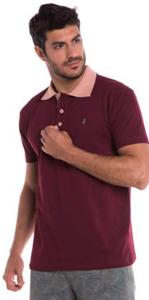
REF. 3006 CAMISETA //////////////////// Polo Street 98%Alg 2% Elast. Tam. P ao GG