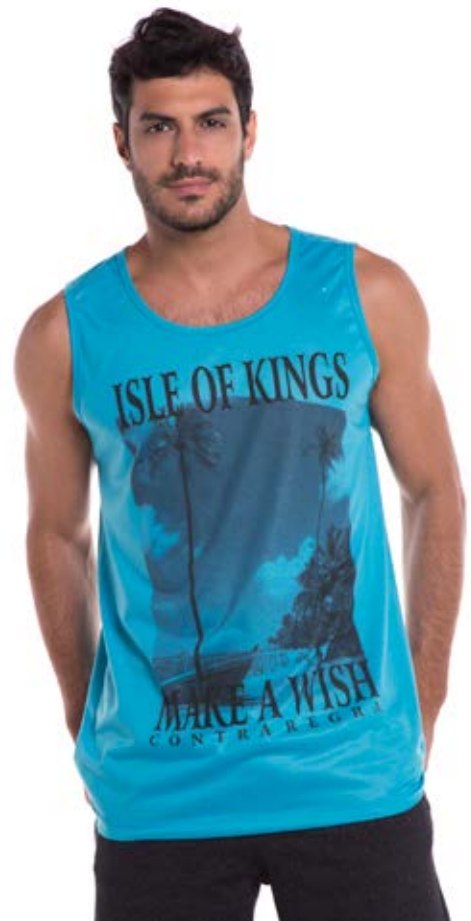
REF.4446 CAMISETA REGATA /////////////////////////////////////////////////////////////////// Street 65% Pol. 35% Visc. Tam. P ao GG