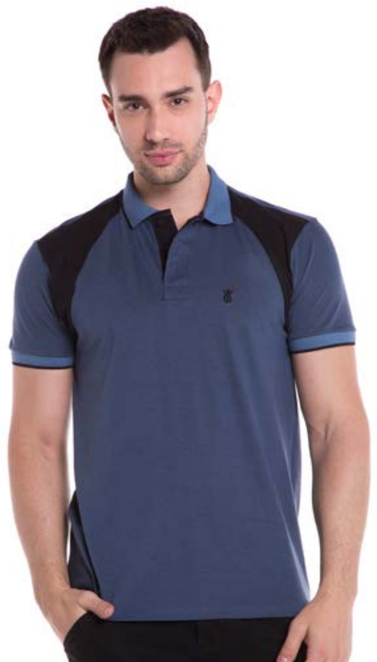
REF. 3813 CAMISETA //////////////////// Polo Piquet Major Tradicional 68% Alg. 29% Pol. 3% Elast. Tam. P ao S5