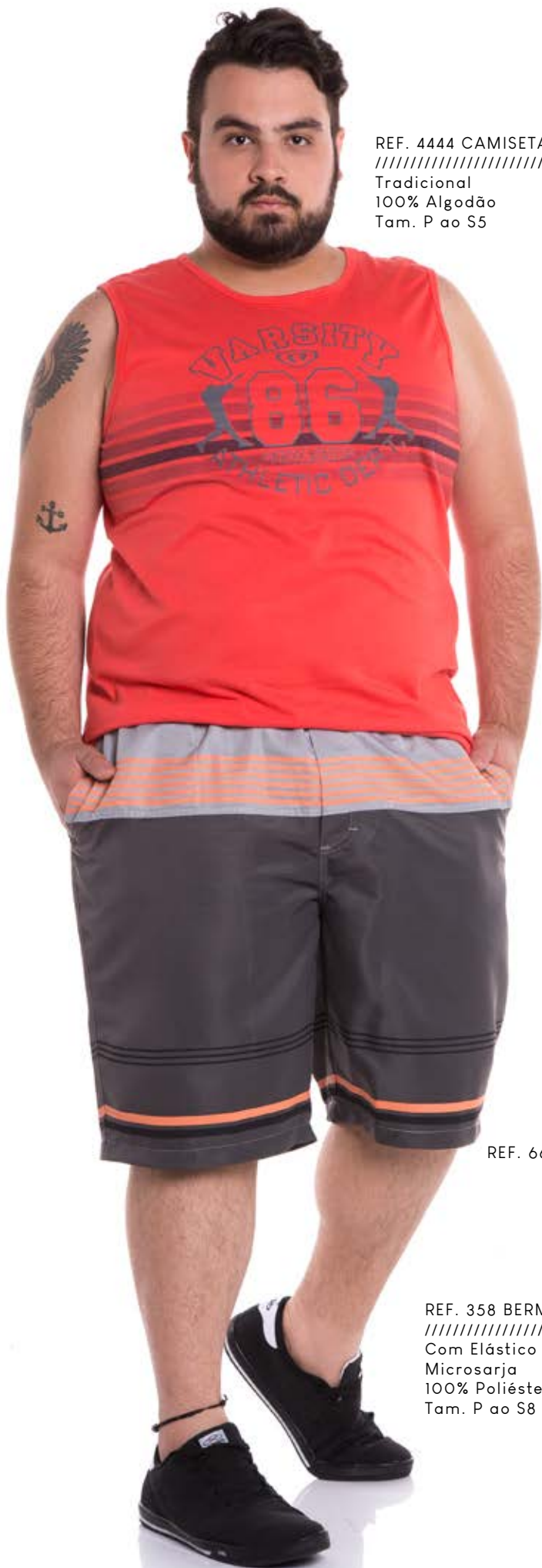
REF. 4444 CAMISETA REGATA //////////////////// Tradicional 100% Algodão Tam. P ao S5