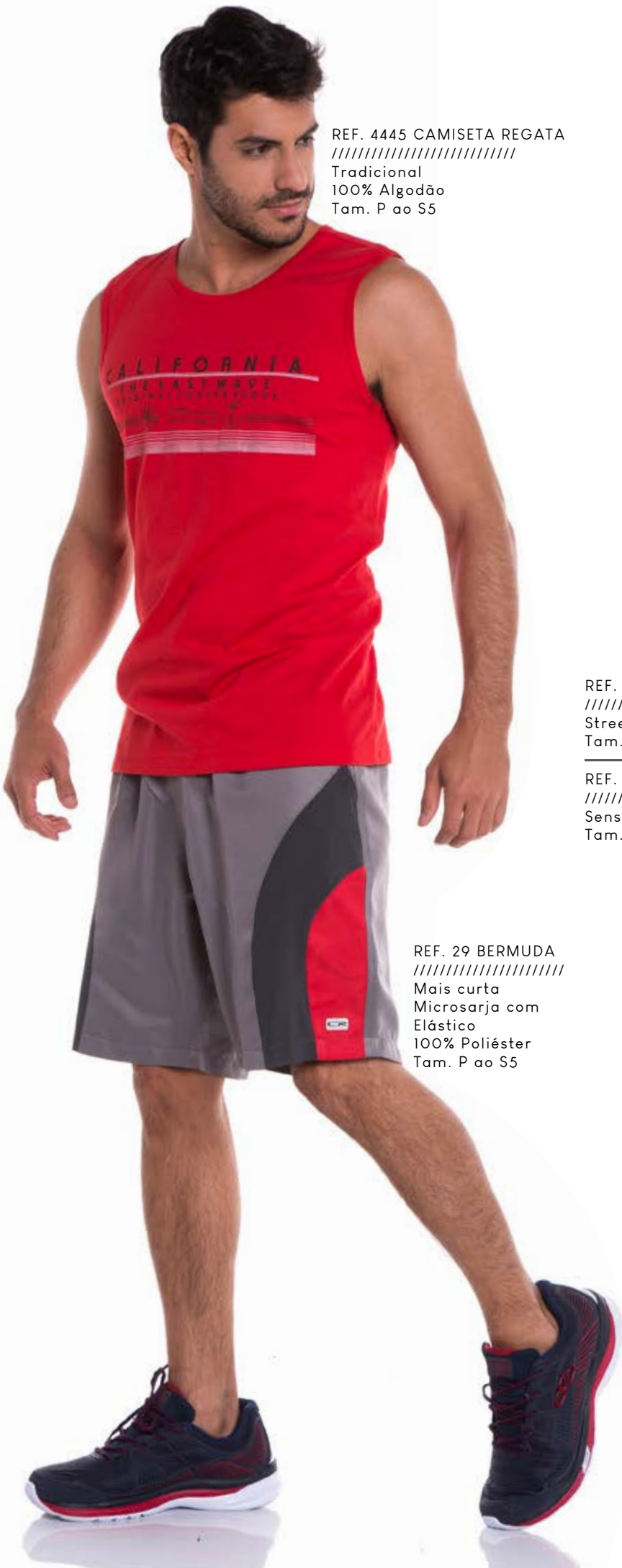
REF. 4445 CAMISETA REGATA //////////////////// Tradicional 100% Algodão Tam. P ao S5