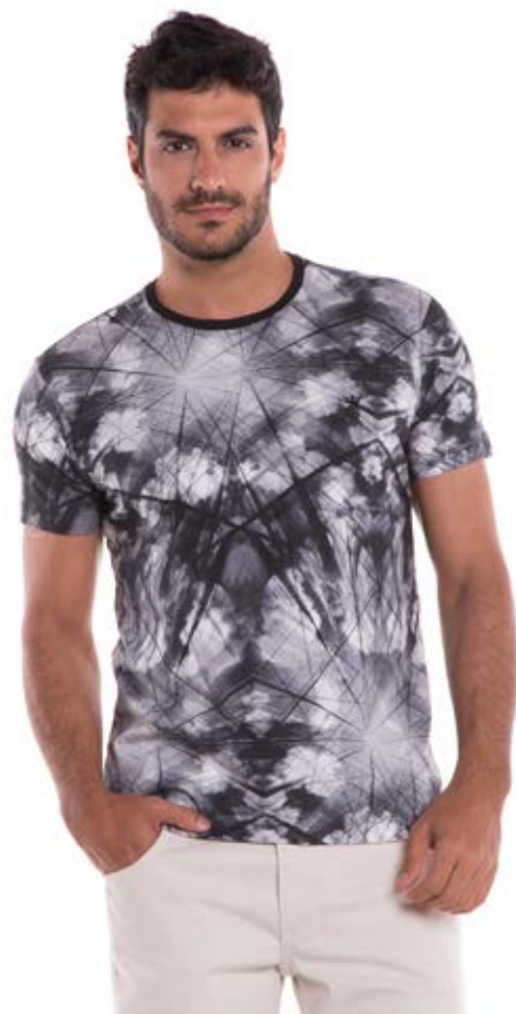
REF. 1198 CAMISETA //////////////////// Petenatti Street 100% Algodão Tam. P ao GG