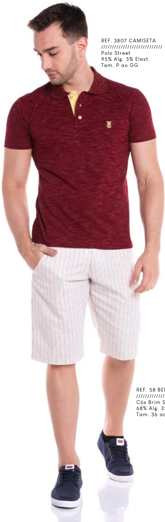
REF. 3807 CAMISETA //////////////////// Polo Street 95% Alg. 5% Elast. Tam. P ao GG