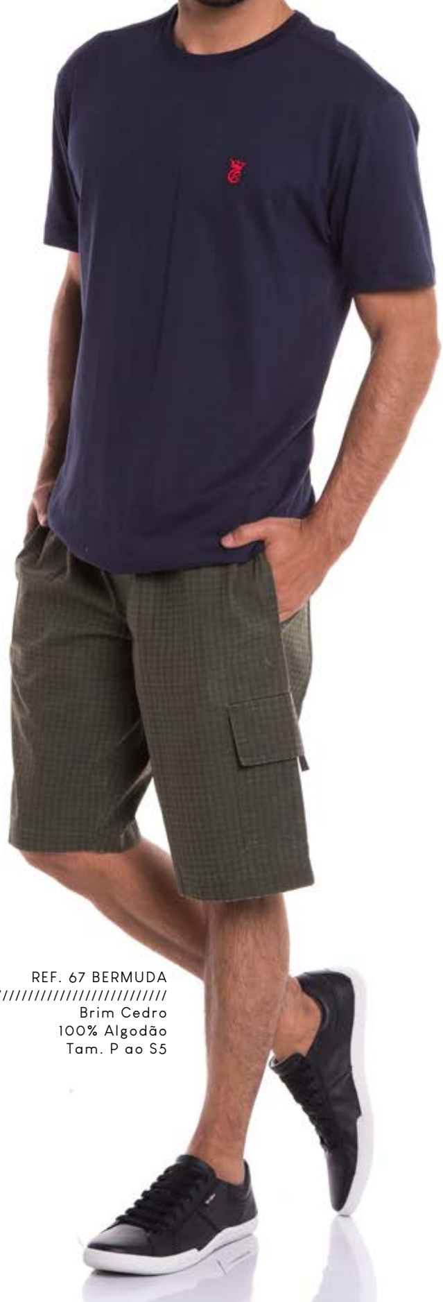
REF. 67 BERMUDA //////////////////// Brim Cedro 100% Algodão Tam. P ao S5