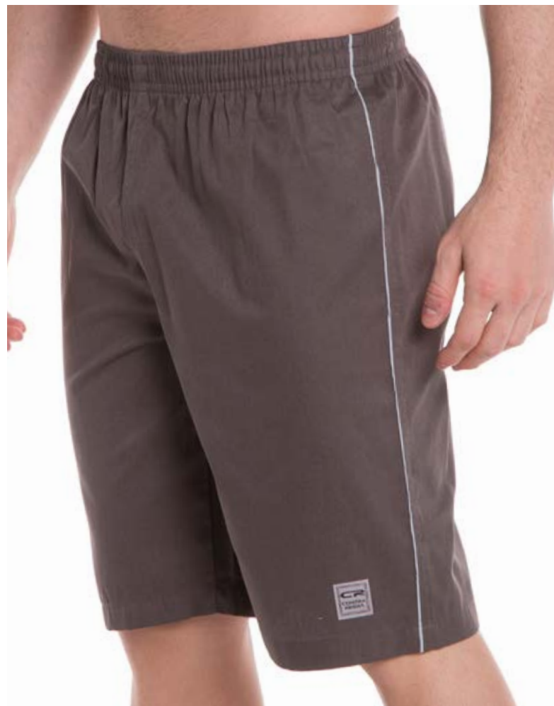
REF. 392 BERMUDA //////////////////// Brim com Elástico 100% Algodão Tam. P ao S5