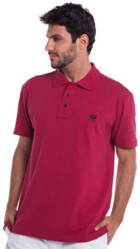
REF. 3801 CAMISETA //////////////////// Polo Pique Tradicional 98% Alg. 2% Elast. Tam. P ao S5