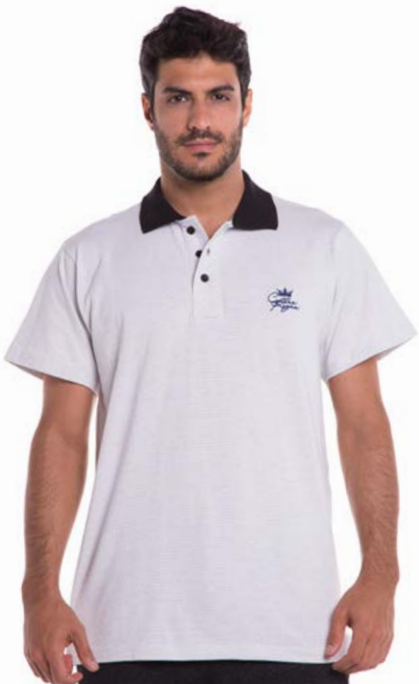
REF. 3806 CAMISETA //////////////////// Polo Tradicional York 98% Alg. 2%Elast. Tam. P ao S5