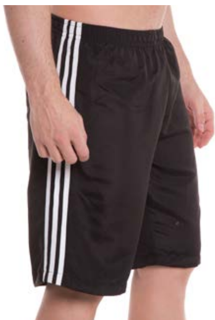
REF 84 BERMUDA /////////////////////////////////// Microfibra com Elástico 100% Poliéster Tam. P ao S4