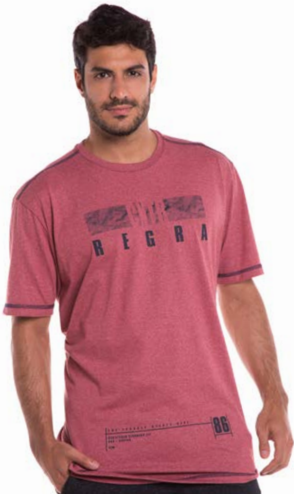
REF. 1175 CAMISETA //////////////////// Melange Tradicional 50% Alg. 50% Pol. Tam. P ao S8