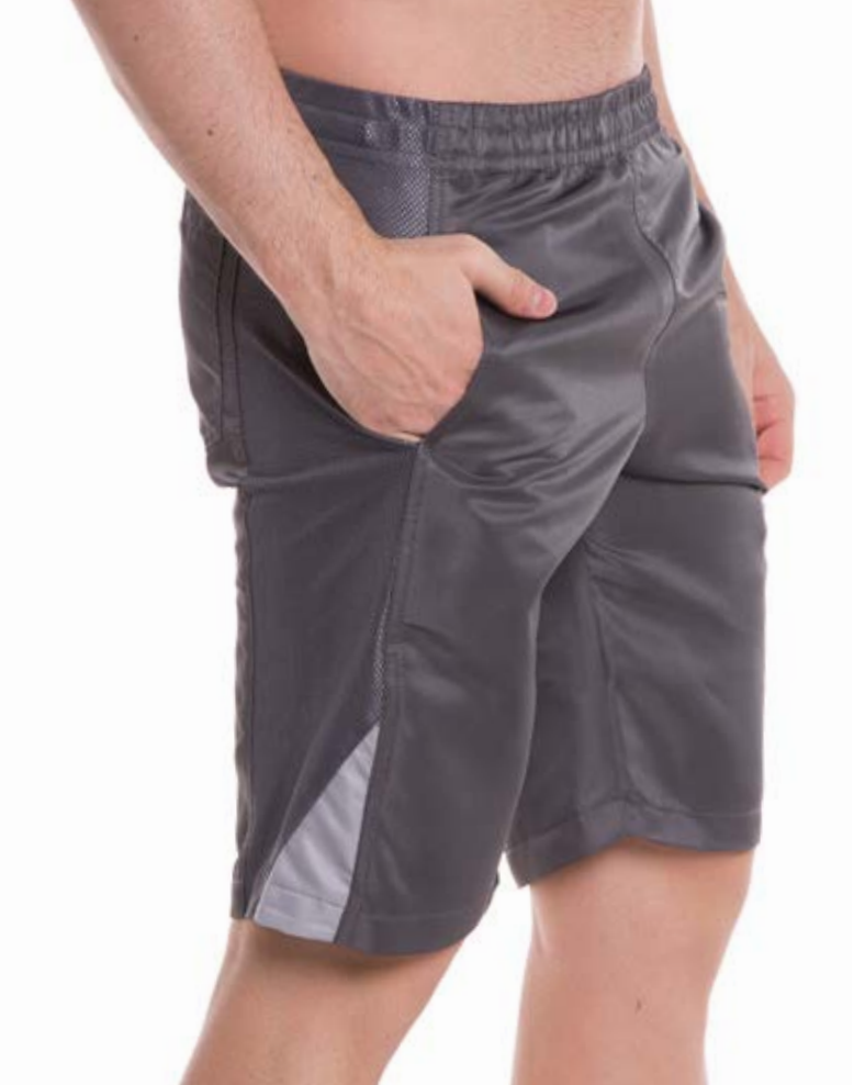
REF. 09 BERMUDA ////////////////////////////////////// Microsarja com Elástico 100% Poliéster Tam. P ao S8