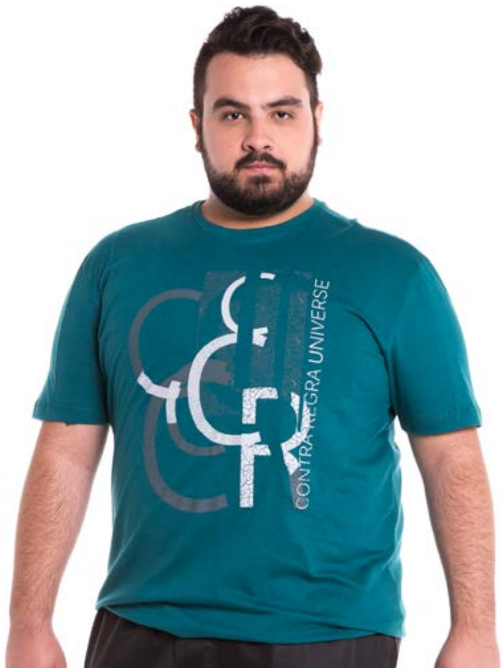
REF. 1214 CAMISETA //////////////////// Tradicional 100% Algodão Tam. P ao S8