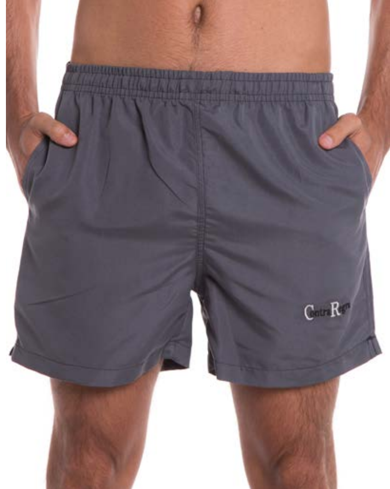
REF. 61 SHORTS //////////////////// Microfibra com Elástico 100% Poliéster Tam. P ao S8