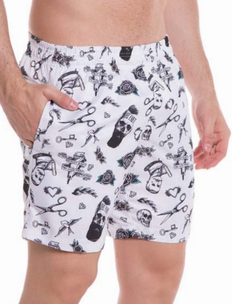
REF.72 SHORTS //////////////////// Microsarja Sublimado 100% Poliéster Tam. P ao GG