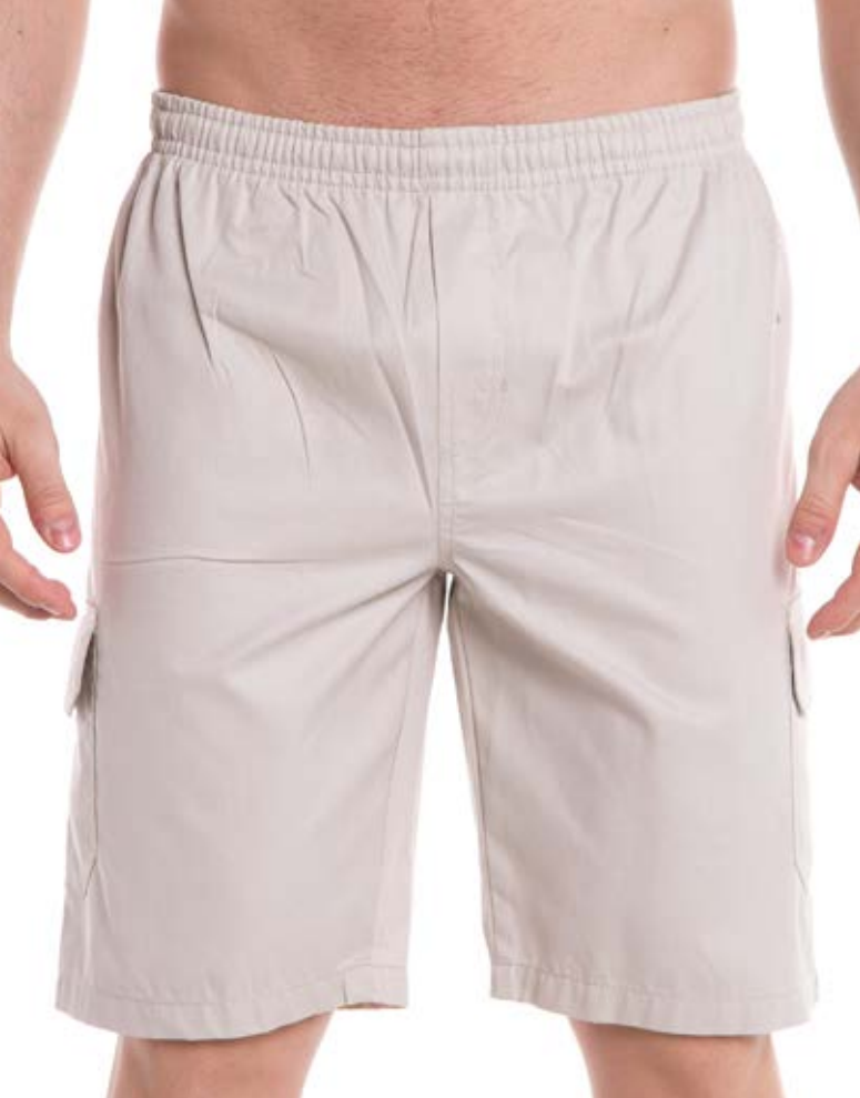
REF. 374 BERMUDA //////////////////// Brim com Elástico 100% Algodão Tam. P ao S5