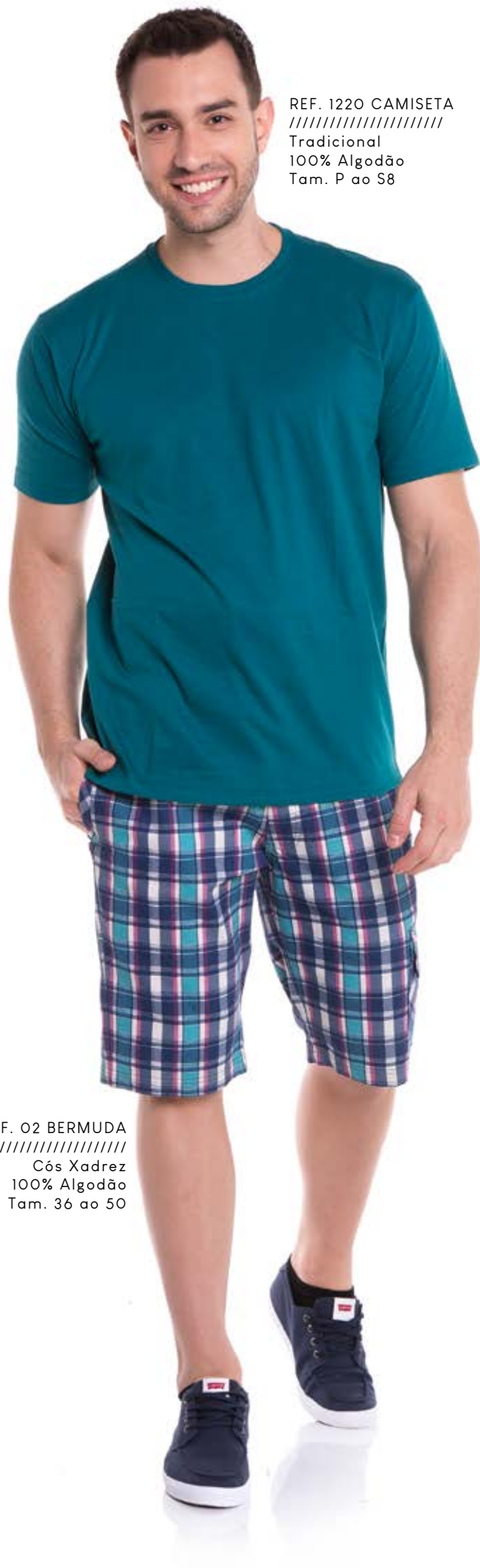
REF. 1220 CAMISETA //////////////////// Tradicional 100% Algodão Tam. P ao S8