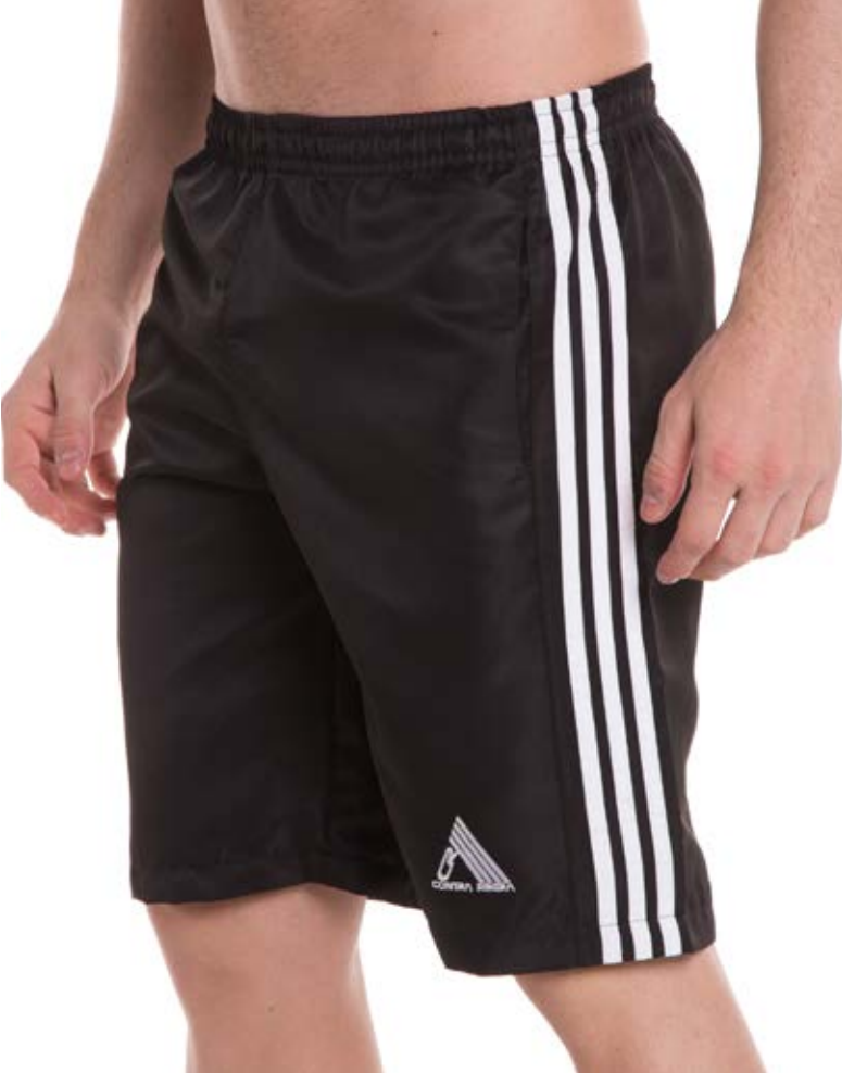
REF. 496 BERMUDA //////////////////// Microsarja com Elástico 100% Poliéster Tam. 4 ao S8