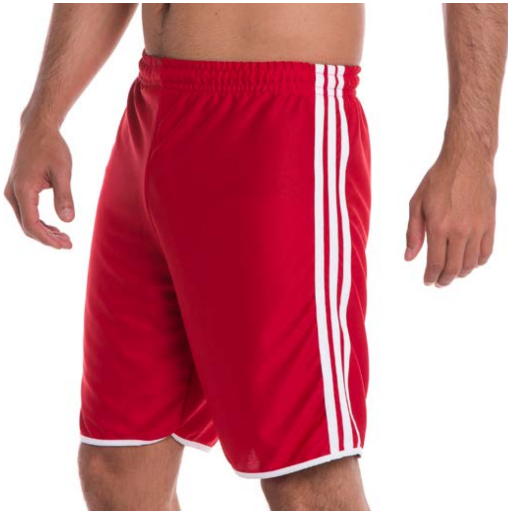
REF. 441 BERMUDA //////////////////// Helanca com Elástico 100% Poliéster Tam. 6 ao S3