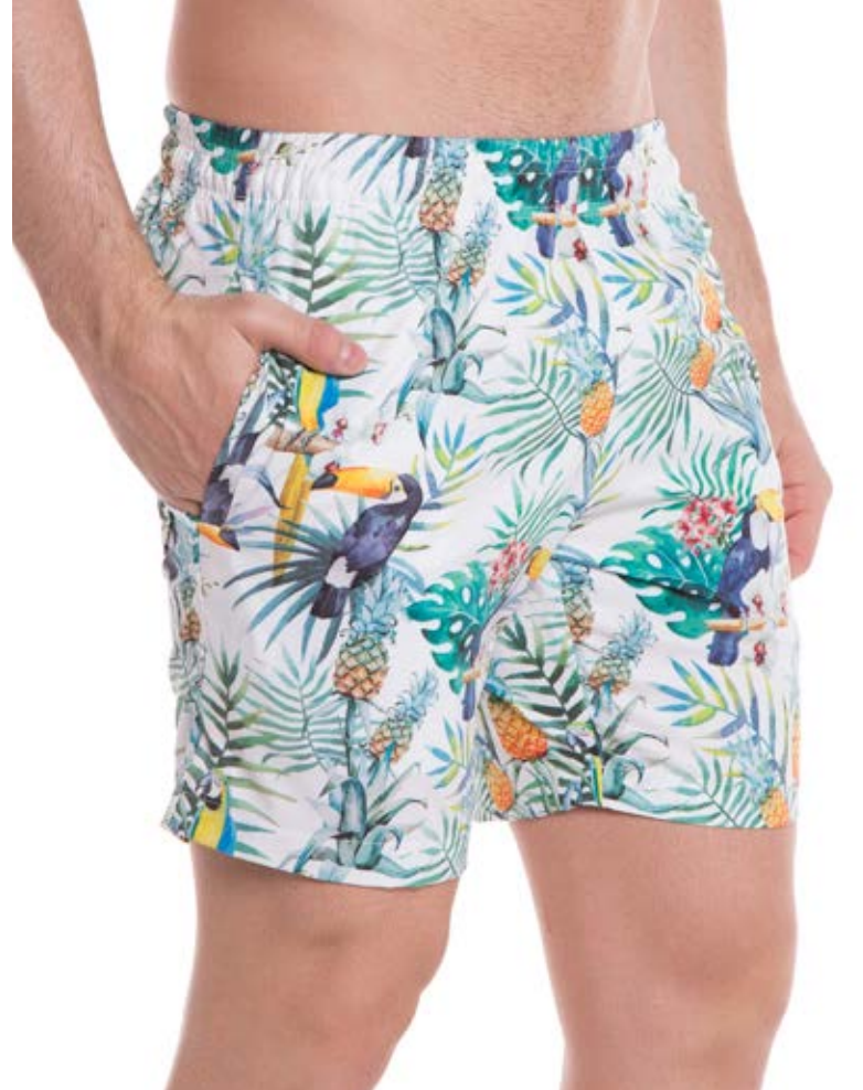
REF.75 SHORTS ////////////////////////////////////// New Hidronatic Sublimado 95% Poliéster 5%Elastano Tam. P ao S2