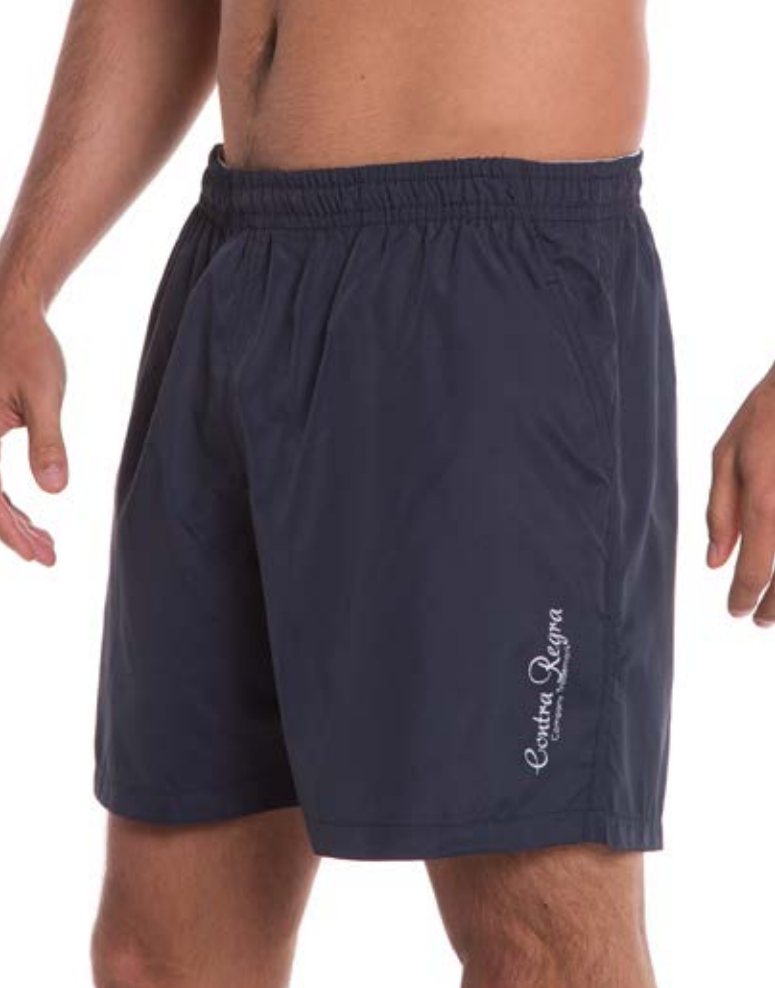
REF 710 SHORTS //////////////////// Exim de Elástico 100% Poliéster Tam. P ao S5