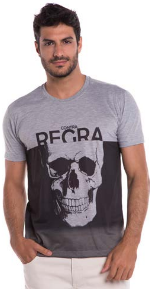
REF. 1201 CAMISETA //////////////////// Street Sublimada 65%Pol. 35% Visc. Tam. P ao GG