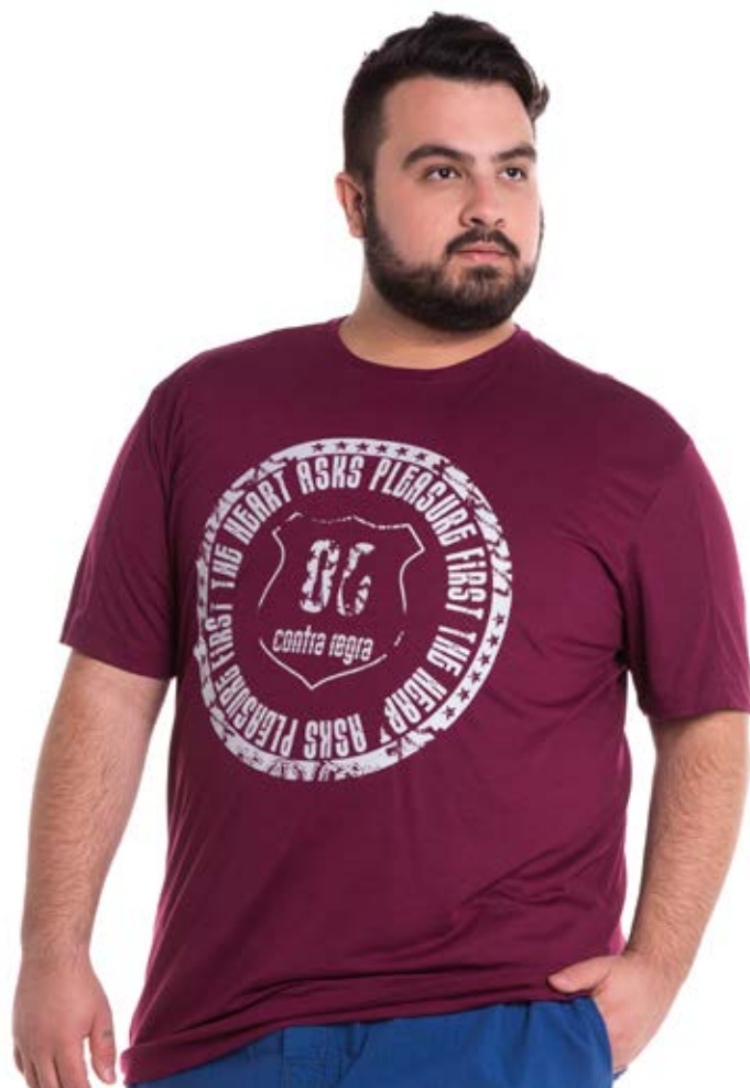
REF.1137 CAMISETA //////////////////// Tradicional 65% Alg. 35% Pol. Tam. P ao S5