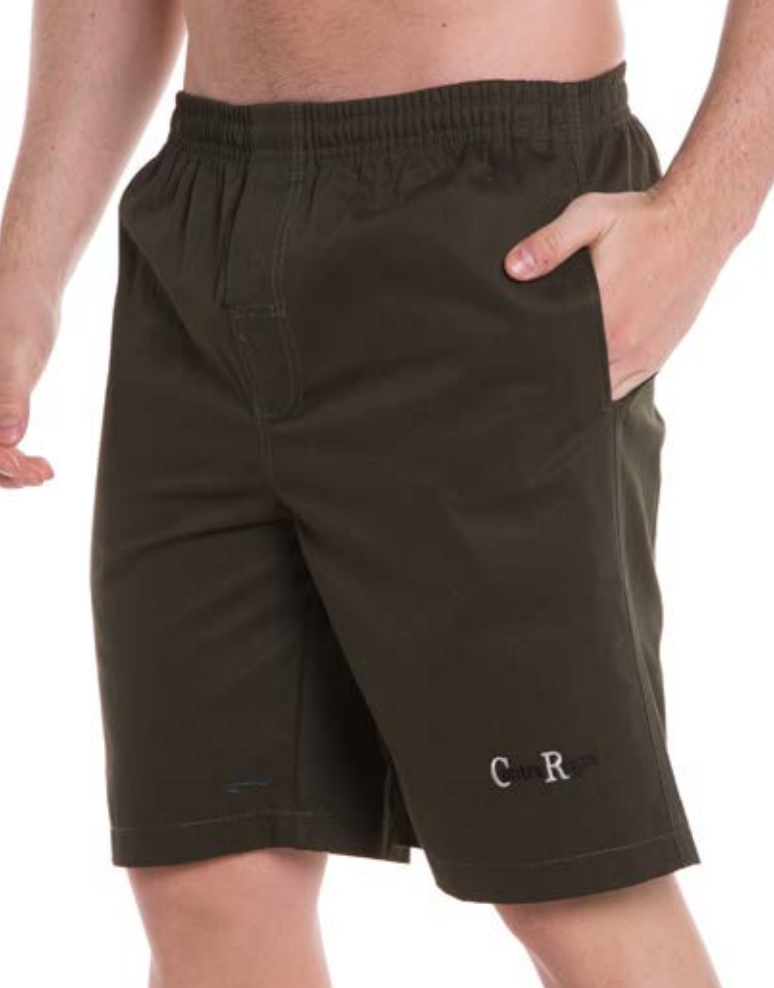
REF. 90 BERMUDA //////////////////// Microfibra de Elástico 100% Poliéster Tam. P ao S8