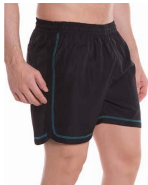
REF.30 SHORTS /////////////////////////////////// Exim de elástico 100% Poliéster Tam. P ao GG