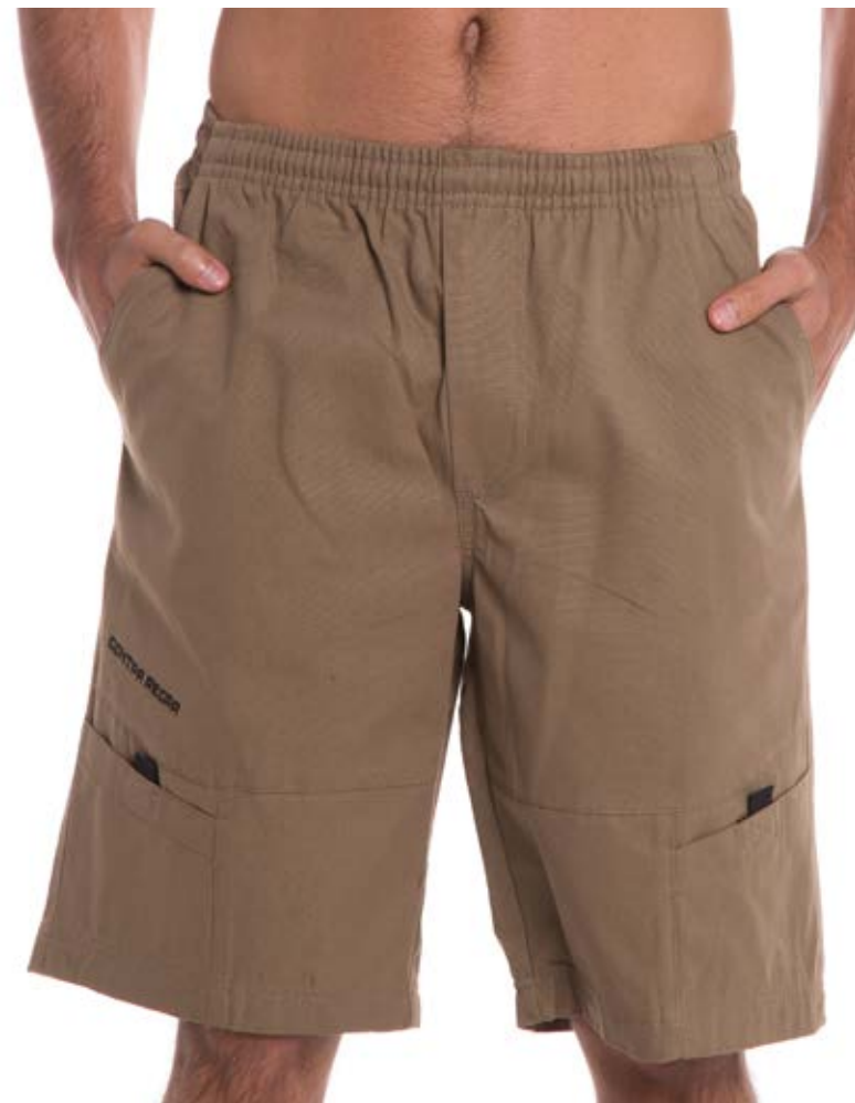
REF. 28 BERMUDA //////////////////// Microsarja com Elástico 100% Poliéster Tam. P ao S5