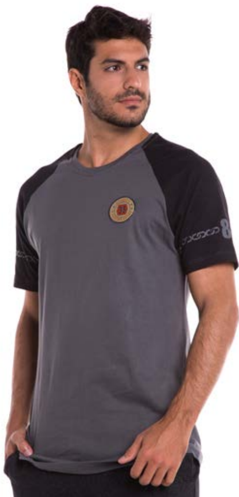
REF. 1224 CAMISETA //////////////////// Collor Tradicional 100% Algodão Tam. P ao S5