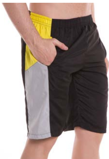
REF. 79 BERMUDA /////////////////////////////////// Microfibra com Elástico 100% Poliéster Tam. P ao S4