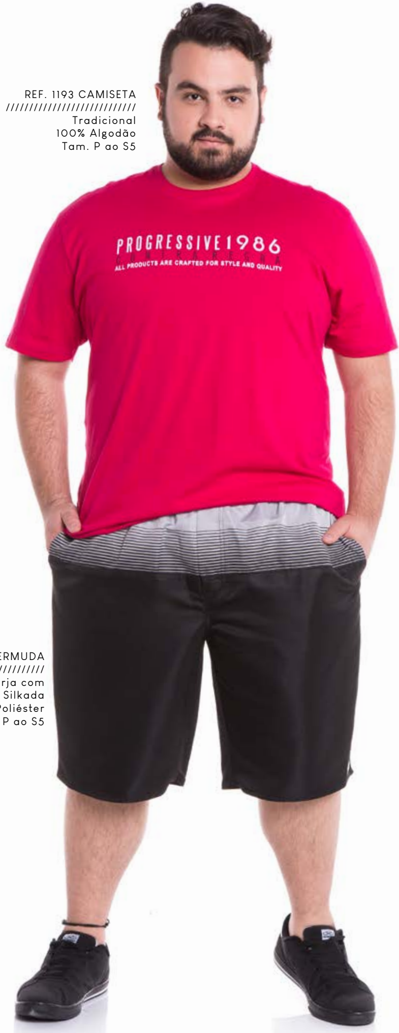
REF. 823 BERMUDA //////////////////// Microsarja com Elástico Silkada 100% Poliéster Tam. P ao S5