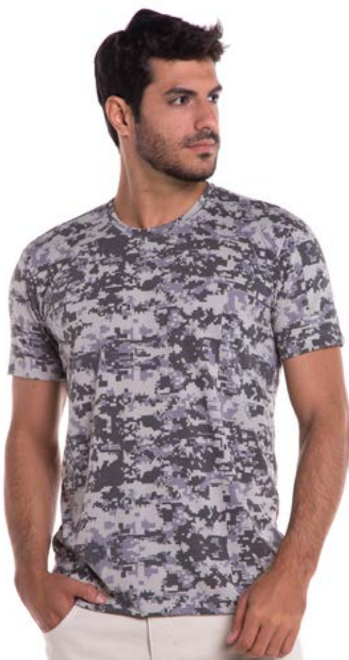
REF. 1217 CAMISETA //////////////////// Combat Street 67% Pol. 33% Visc. Tam. P ao GG