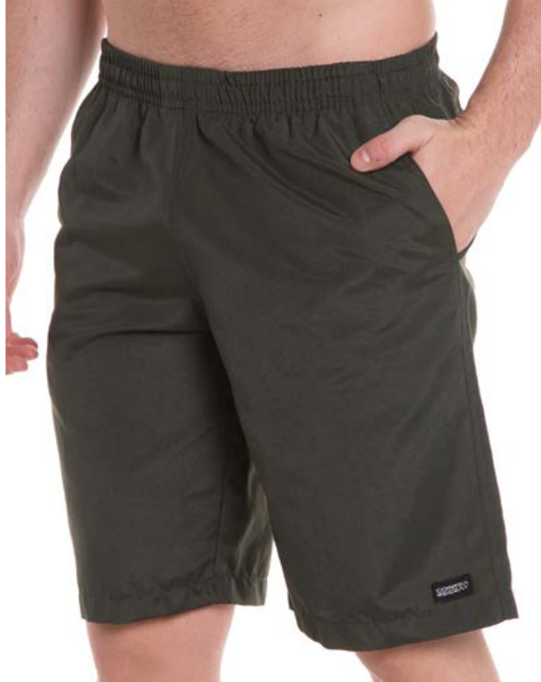
REF. 27 BERMUDA //////////////////// Nytom de Elástico 75% alg. 25% Pol. Tam. P ao S8