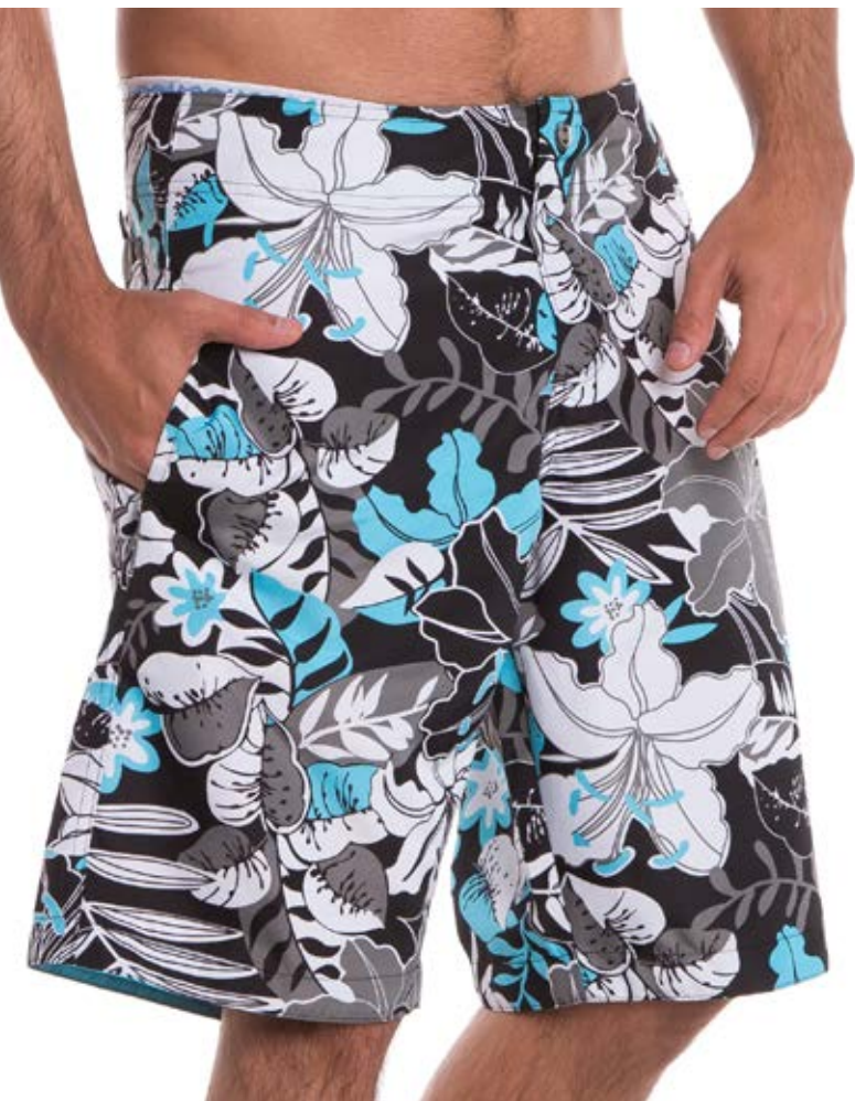
REF. 34 BERMUDA //////////////////// Cós estampada Exim Wene 100% Poliéster Tam. 4 ao 52