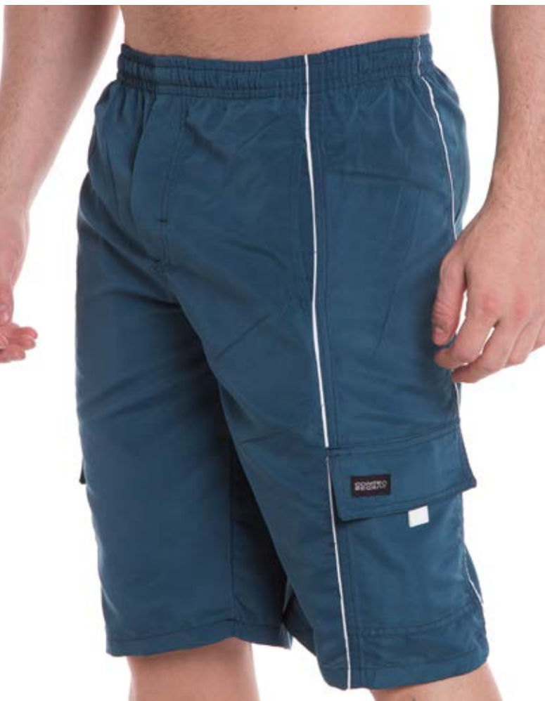
REF. 498 BERMUDA //////////////////// Microfibra com Elástico 100% Poliéster Tam. 4 ao S5