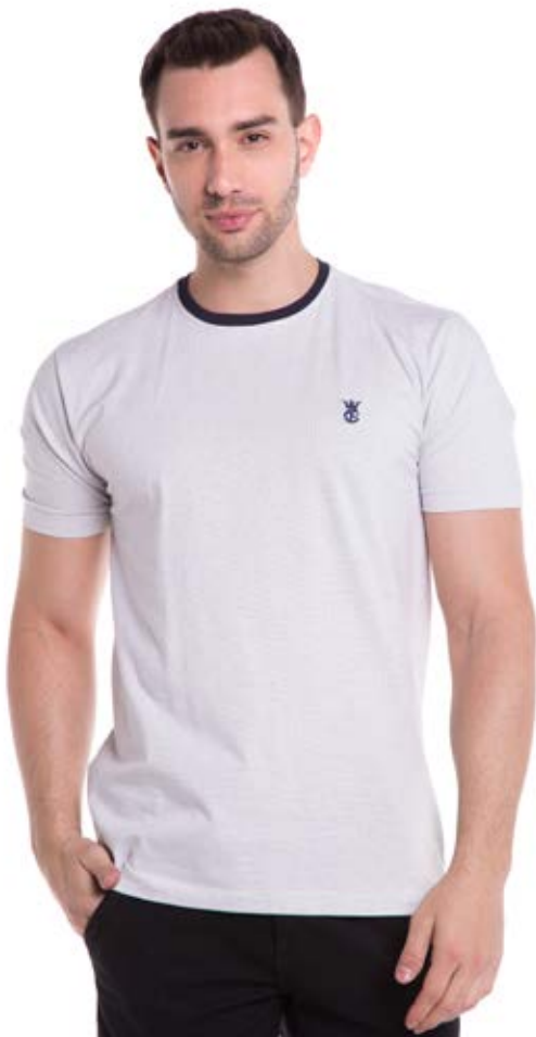
REF 1233 CAMISETA //////////////////// Tradicional 98% Algodão 2% Elast. Tam. P ao S5