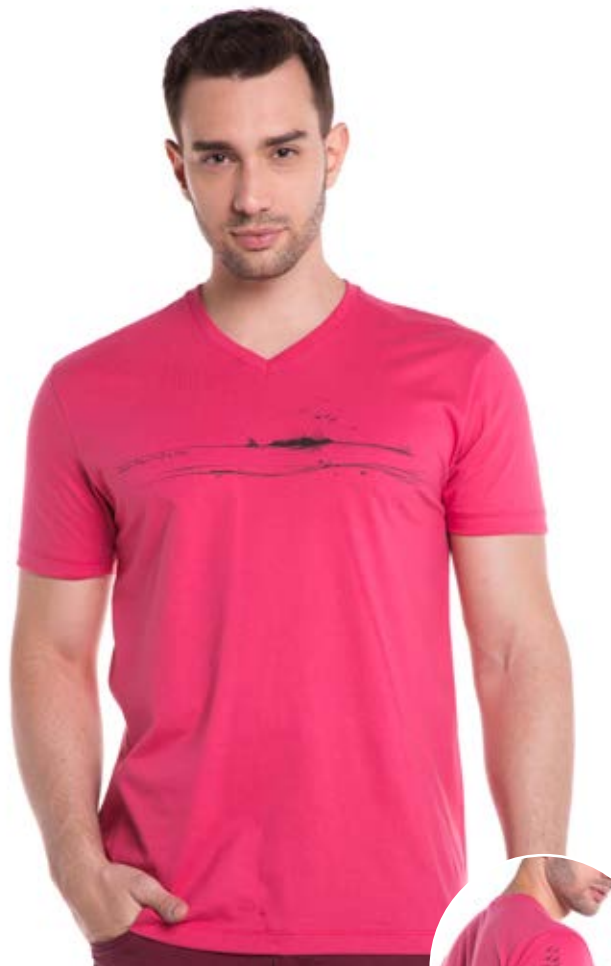
REF. 1213 CAMISETA //////////////////// Tradicional 100% Algodão Tam. P ao S5