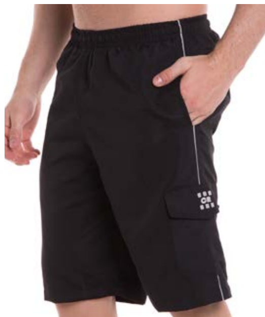
REF. 779 BERMUDA Microfibra com Elástico 100% Poliéster Tam. 4 ao S5