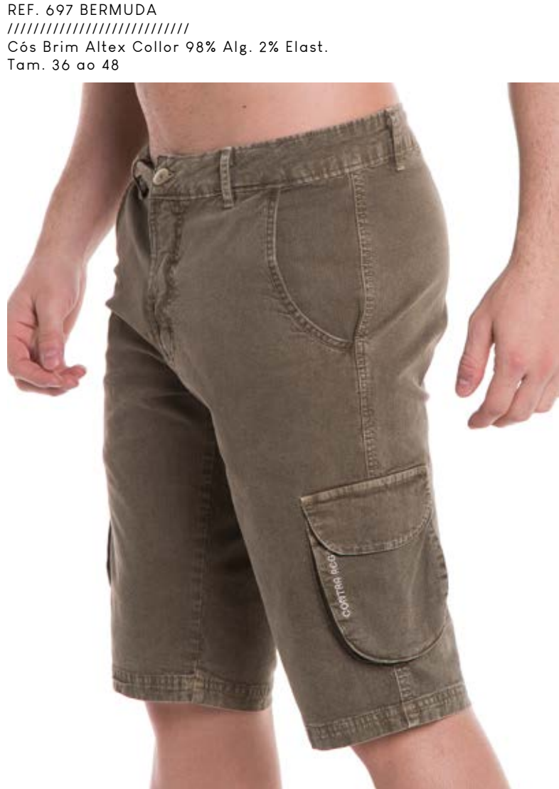
REF. 697 BERMUDA //////////////////// Cós Brim Altex Collor 98% Alg. 2% Elast. Tam. 36 ao 48