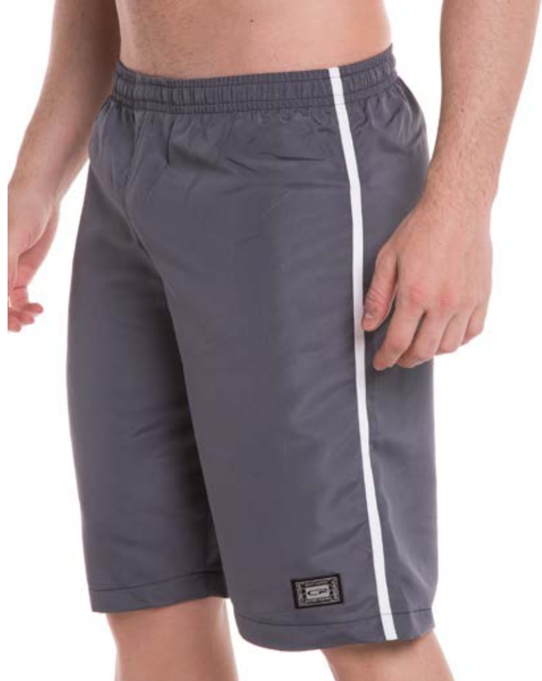
REF.537 BERMUDA //////////////////// Microfibra com Elástico 100% Poliéster Tam. 2 ao S5