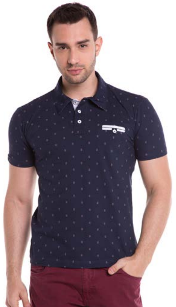
REF. 3803 CAMISETA //////////////////// Polo Street Piquet Slim 98% Alg. 2% Elast. Tam. P ao GG