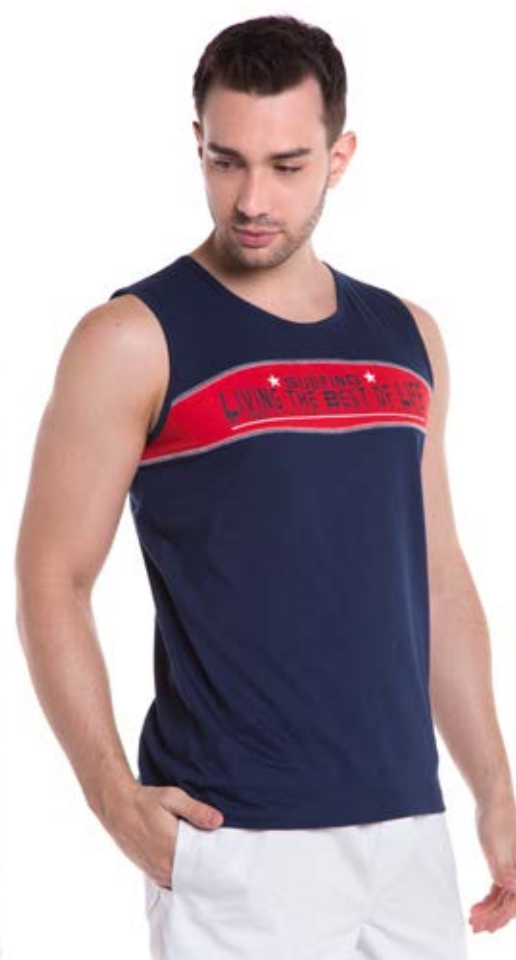
REF. 4447 CAMISETA REGATA /////////////////////////////////////////////////////////////////// Tradicional 100% Algodão Tam. P ao S5