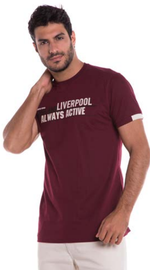
REF. 1200 CAMISETA //////////////////// Tradicional 100% Algodão Tam. P ao S8