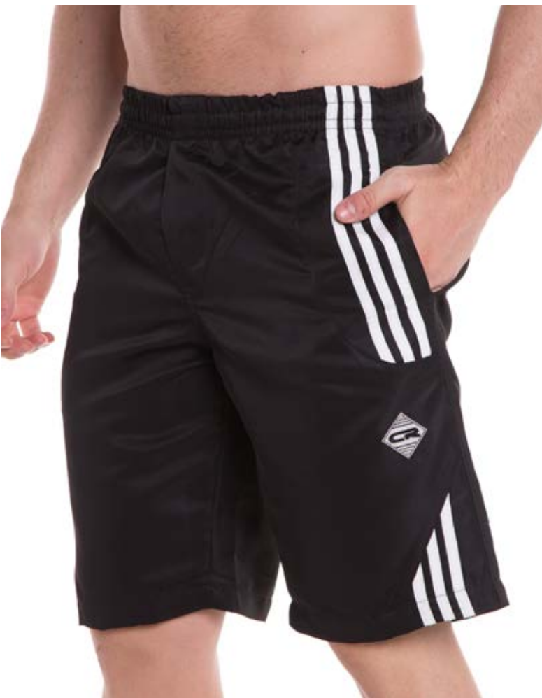
REF. 723 BERMUDA //////////////////// Microsarja com Elástico 100% Poliéster Tam. 8 ao S8