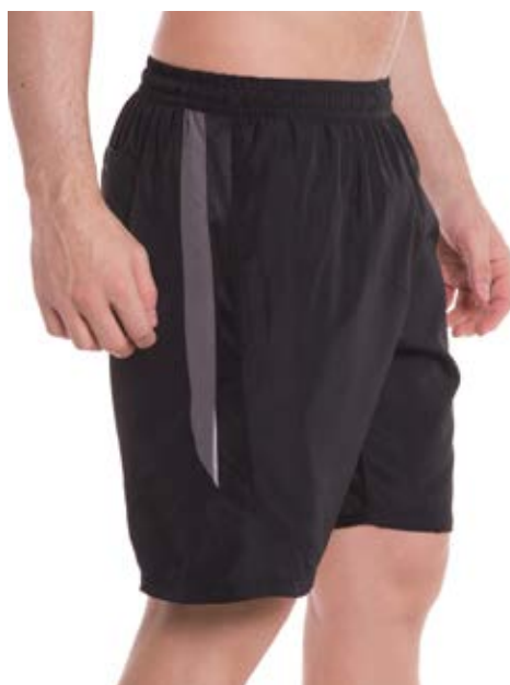
REF. 40 BERMUDA MAIS CURTA /////////////////////////////////// Elástico Exim 100% Poliéster Tam. P ao S5