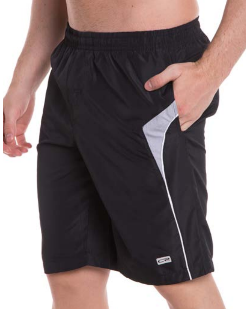
REF. 282 BERMUDA //////////////////// Exim com Elástico 100% Poliéster Tam. P ao S5