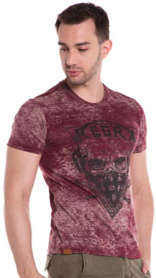
REF. 1195 CAMISETA //////////////////// Street Laser Wash 100% Algodão Tam. P ao GG