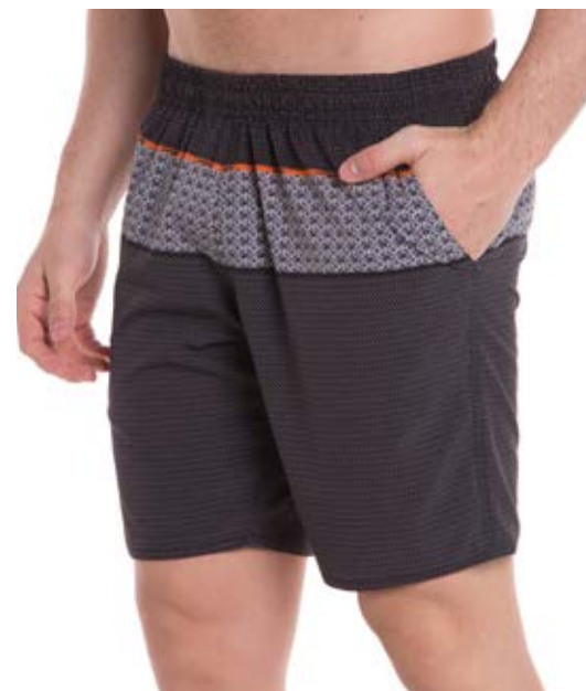
REF. 07 BERMUDA MAIS CURTA Four Way Sublimada 91,55% Poliéster 8,45% Elástano Tam. P ao GG