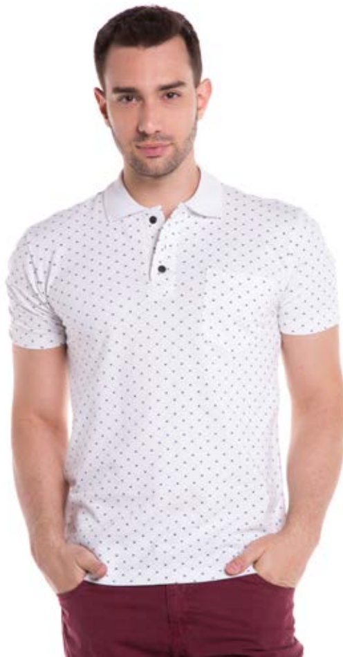
REF. 3804 CAMISETA //////////////////// Polo Piquet Confort Tradicional 98% Alg. 2% Elast. Tam. P ao S5