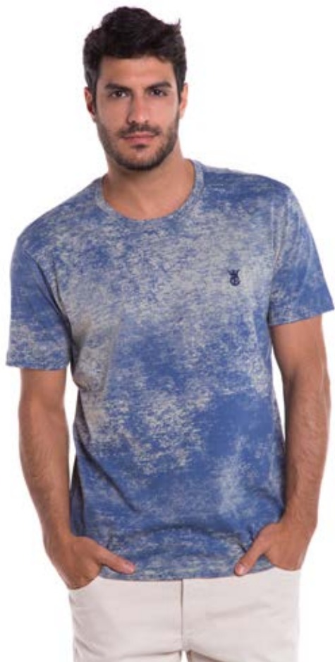
REF. 1191 CAMISETA //////////////////// Laser Street 100% algodão Tam. P ao GG