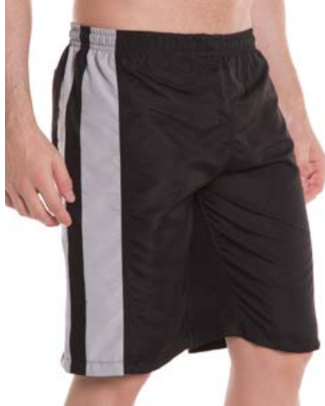
REF. 81 BERMUDA /////////////////////////////////// Microfibra com Elástico 100% Poliéster Tam. P ao S4