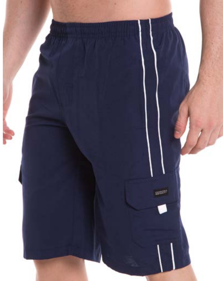
REF. 50 BERMUDA //////////////////// Nyton com Elástico 75%alg. 25%pol. Tam. 4 ao S8