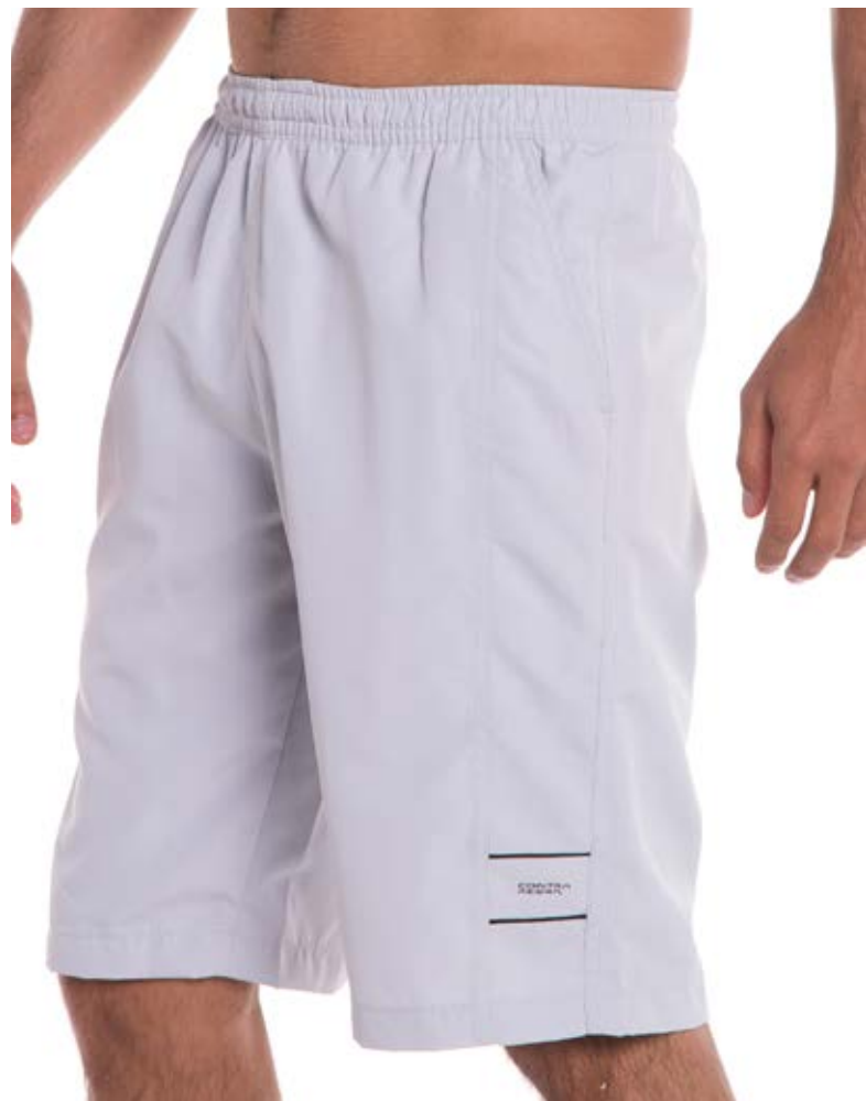
REF. 717 BERMUDA //////////////////// Exim com Elástico 100% Poliéster Tam. P ao S5