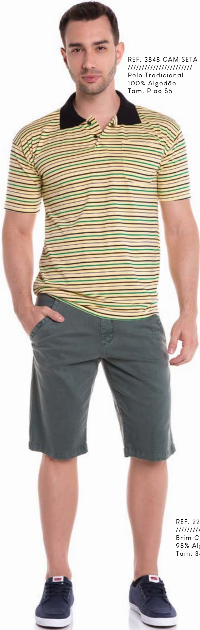
REF. 3848 CAMISETA //////////////////// Polo Tradicional 100% Algodão Tam. P ao S5