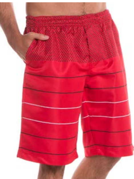
REF. 69 BERMUDA Microsarja com Elástico Silkada 100% Poliéster Tam. 4 ao S8