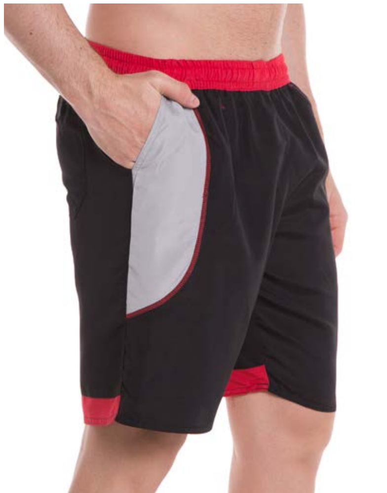
REF. 716 BERMUDA MAIS CURTA //////////////////// Microfibra Elástico 100% Poliéster Tam. P ao S5