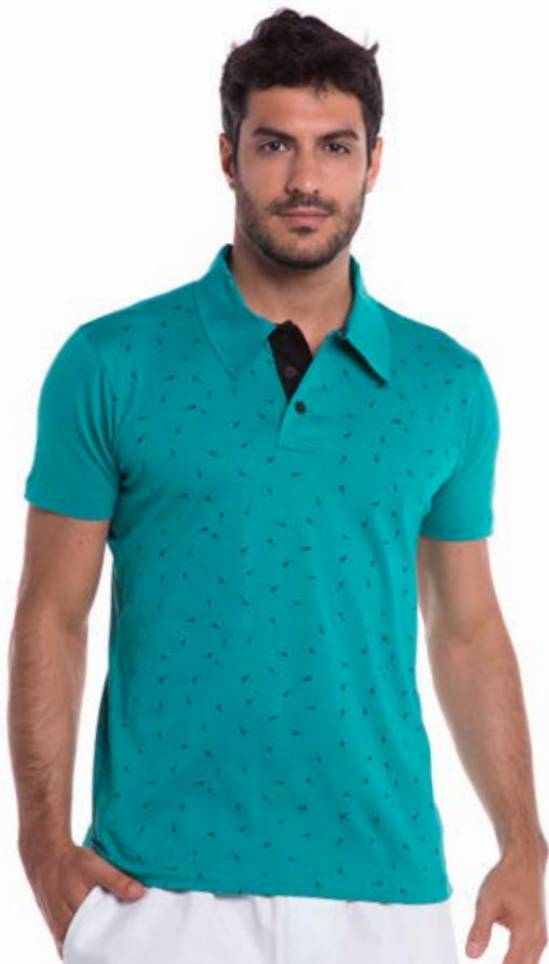
REF. 3802 CAMISETA //////////////////// Polo Street Estampada 100% Algodão Tam. P ao GG