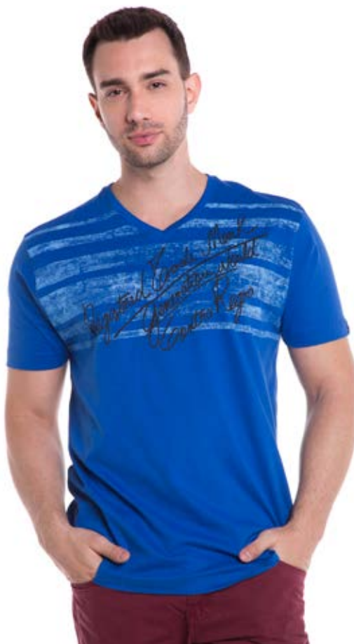
REF. 1153 CAMISETA /////////////////////////////////////////////////////////////////// Tradicional 100% Algodão Tam. P ao S8