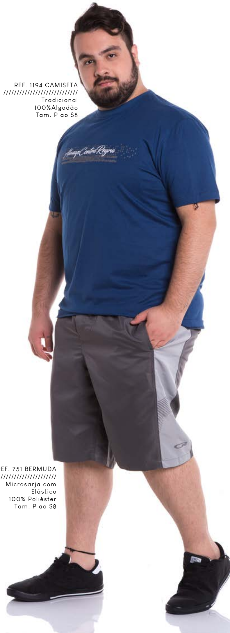
REF. 1194 CAMISETA //////////////////// Tradicional 100% Algodão Tam. P ao S8