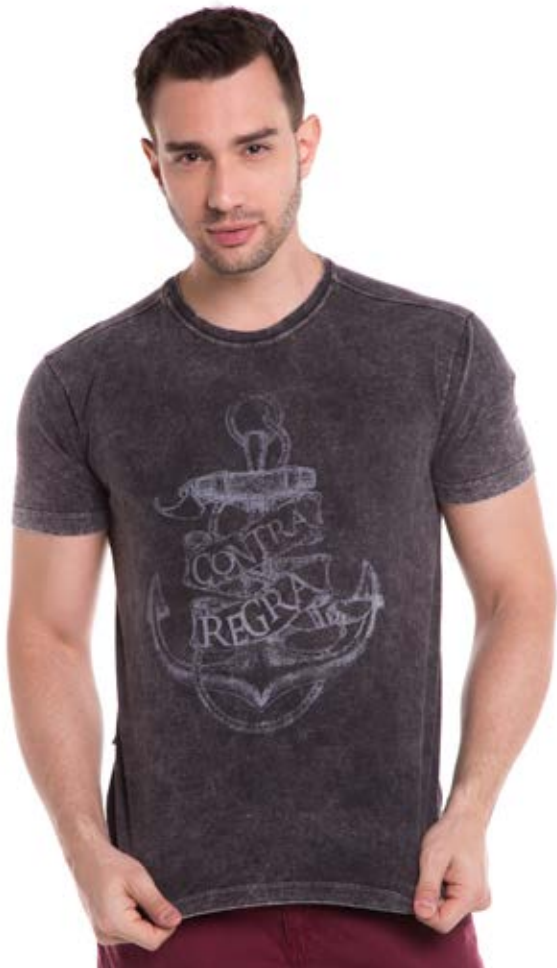
REF.1231 CAMISETA //////////////////// Street Collor 100% Algodão Tam. P ao GG