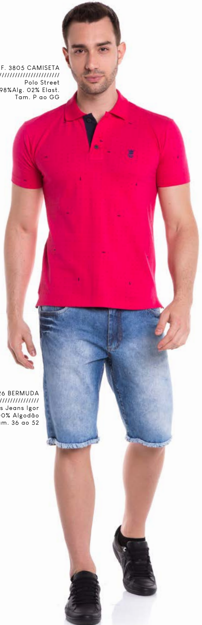
REF. 3805 CAMISETA //////////////////// Polo Street 98%Alg. 02% Elast. Tam. P ao GG