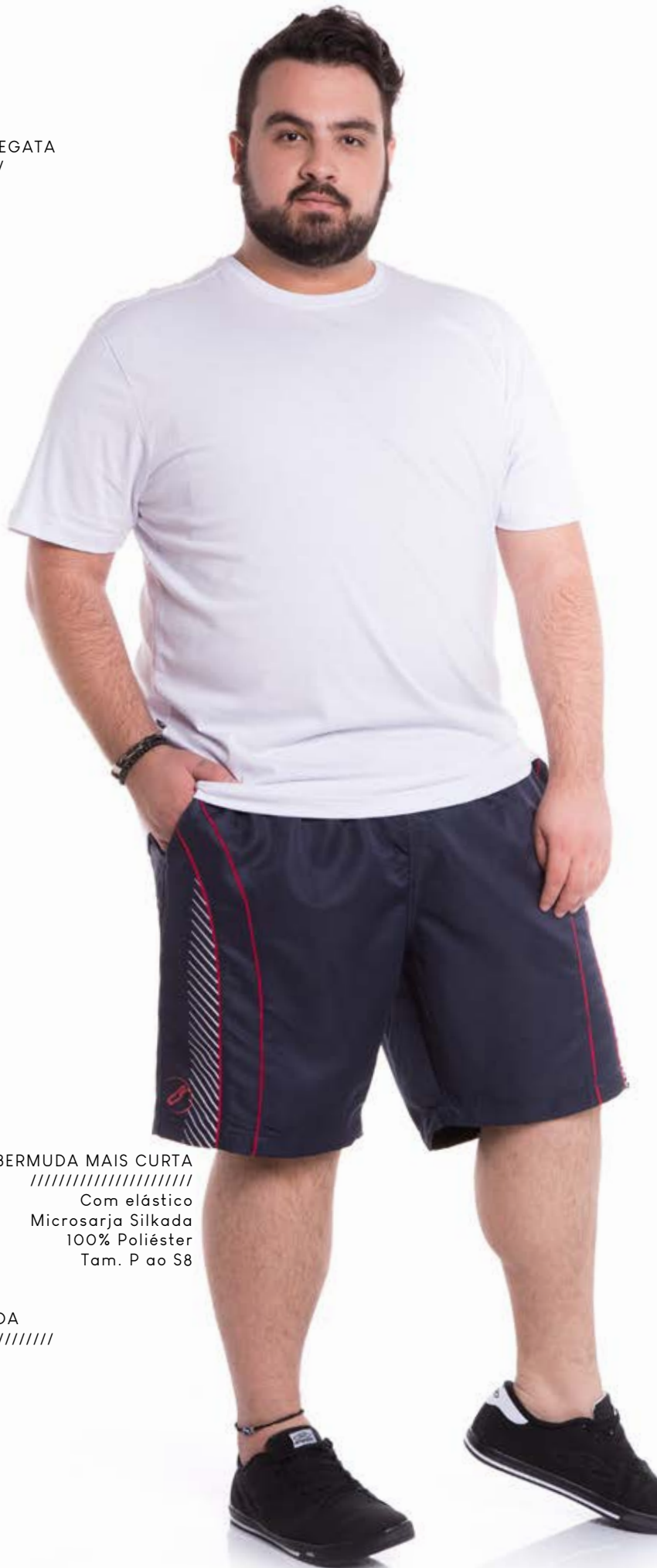
REF. 661 BERMUDA MAIS CURTA //////////////////// Com elástico Microsarja Silkada 100% Poliéster Tam. P ao S8