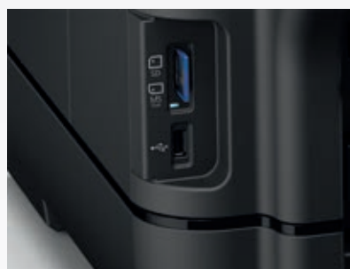
Porta USB e leitor de cartão de memória