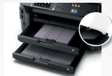
2 alimentadores de 250 folhas + 1 alimentador traseiro