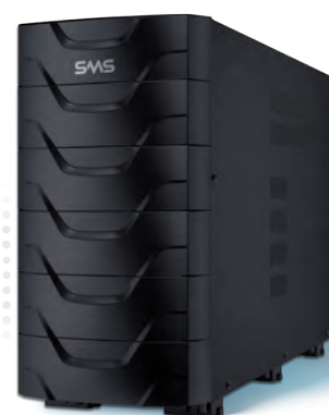
Módulo externo de baterias