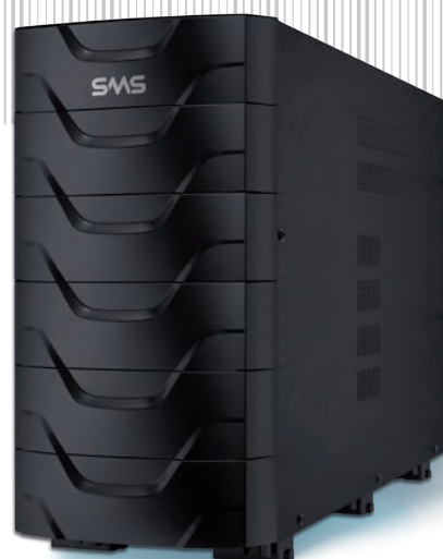
Módulo externo de baterias