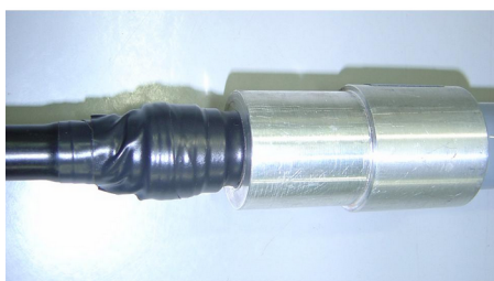
Isolação da conexão