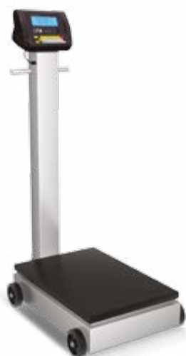
Versão coluna e rodas