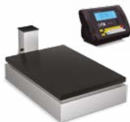
Versão indicação remota