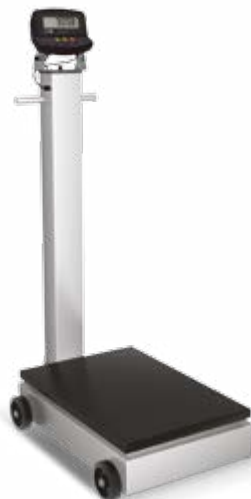
Versão coluna e rodas