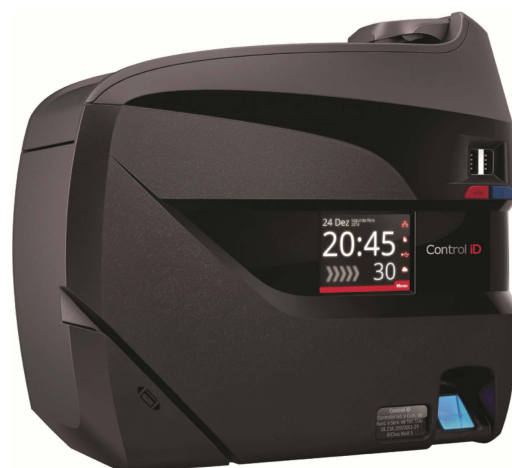
TABELA DE MODELOS

* As formas de identificação variam conforme o modelo. Ver tabela ao lado.