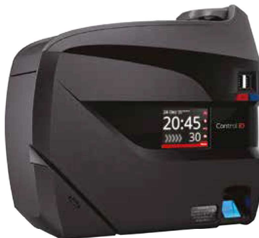
TABELA DE MODELOS