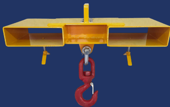
GANCHO GIRATÓRIO COM TRAVA

Movimente cargas em geral com mais segurança e substitua o improvisado com cordas e correntes.