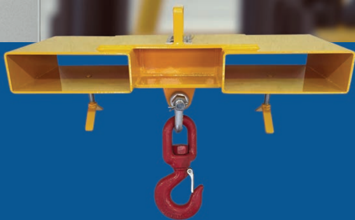
Gancho giratório com trava