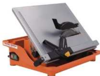
SERRA DE MESA

Aplicação: Serviço de assentamento de pisos, ladrilhos e pedras