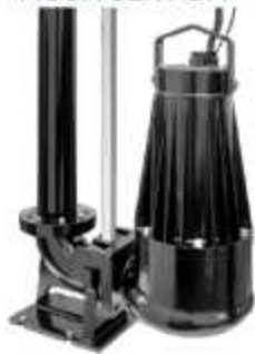
BOMBA PARA ÁGUA SERVIDA

Aplicação: Esgotos residenciais e comerciais Saídas: 2", 3", 4" e 6"