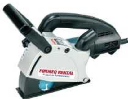
CORTADORA DE PAREDE

Aplicação: Abertura de chanfros em alvenaria para instalação de tubulações (SG 1250) Peso: 4,4 Kg