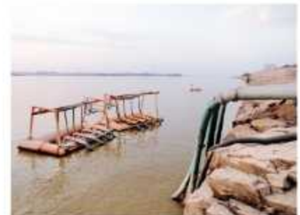
CAPTAÇÃO FLUTUANTE METÁLICA

Aplicação: Serviços de drenagem e abastecimento de água