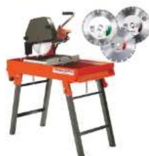
SERRA PARA BLOCOS

Aplicação: Corte de blocos de concreto em obras