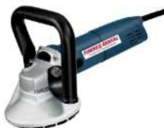
LIXADEIRA PARA CONCRETO

Aplicação: Preparação e alisamento de superfícies