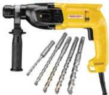
MARTELO PERFURADOR ROMPEDOR

Aplicação: Perfuração de paredes, tetos, pisos de concreto, instalação de cabos e tubos Peso: 2,6 à 4,8 Kg