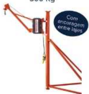
GUINCHO DE JANELA 300 Kg

Aplicação: Elevação de 30m em janelas Capacidade total: 300 Kg