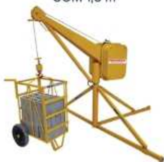
GUINCHO 500 Kg COM 1,5 m

Aplicação: Elevação de 90m de cargas Capacidade total: 500 Kg