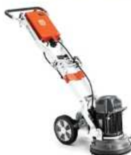
POLITRIZ PARA PISOS

Aplicação: Lixamento e polimento de pisos em concreto ou pedras