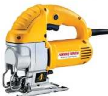
SERRA TICO TICO

Aplicação: Corte de chapas de madeira para formas com espessura de até 40 mm