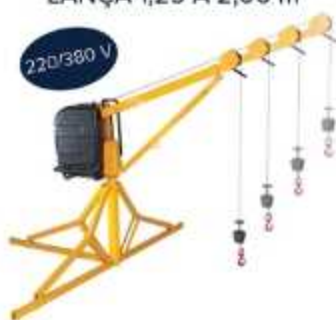
GUINCHO 300/500 Kg LANÇA 1,25 À 2,00 m

Aplicação: Elevação de 90m de cargas Lança: 1,25m (500 Kg) 2,0m (300 Kg)