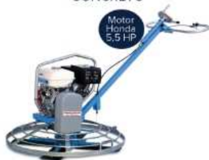
ALISADORA DE CONCRETO

Aplicação: Acabamento pisos e concreto Peso: 80 Kg