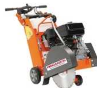
CORTADORA DE PISO

Aplicação: Corte de concreto para juntas de dilatação e instalações Profundidade de corte: 165 mm