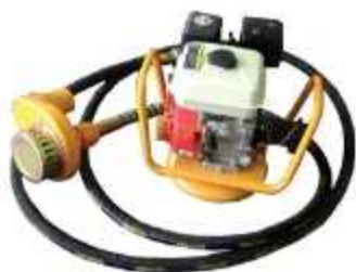
BOMBA DE MANGOTE

Aplicação: Drenagem de brocas, valas e PV's Saída: 2" e 3"