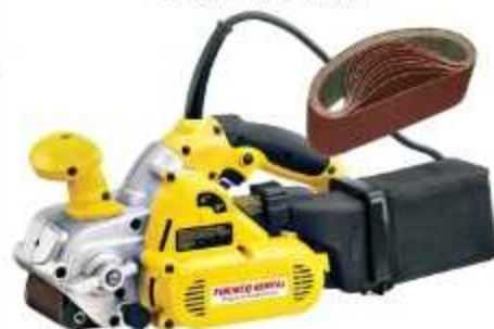
LIXADEIRA DE CINTA PARA MADEIRA

Aplicação: Lixamento técnico de superfícies e remoção de tinta Peso: 5,4 Kg