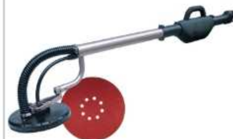
LIXADEIRA DE TETO E PAREDE

Aplicação: Preparação e acabamento das superfícies