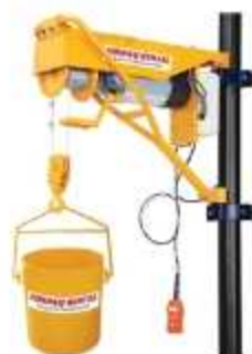
GUINCHO DE COLUNA

Aplicação: Elevação em obras e reformas Capacidade: 200 Kg (60m) e 400 Kg (30m)