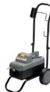
LAVA JATO DOMÉSTICO

Aplicação: Limpeza doméstica Potência: 1600 psi