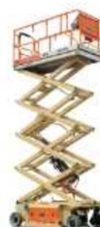
PLATAFORMA TIPO TESOURA

Aplicação: Construção civil, manutenção industrial, hospitais e hotéis. Resiste a trabalho mais pesado. Altura de trabalho 7,60 m