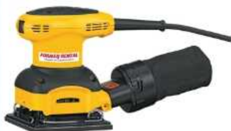
LIXADEIRA ORBITAL VIBRATÓRIA

Aplicação: Preparo de superfícies para pintura Peso: 1 Kg