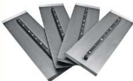
PÁS PARA ALISADORA DE CONCRETO

Aplicação: Serviços de acabamento e desempenho de pisos de concreto