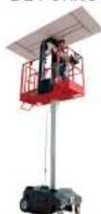
PLATAFORMA COM INSTALADOR DE FORRO

Aplicação: Instalação de forro dry wall e dutos de ar condicionado Altura de trabalho 6,10 m