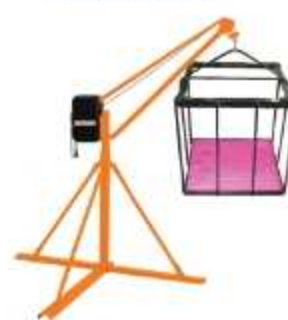
GUINCHO TRIPÉ 300 Kg MONOFÁSICO

Aplicações: Elevação de 30 m de cargas Capacidade total: 300 Kg - Giro 360°