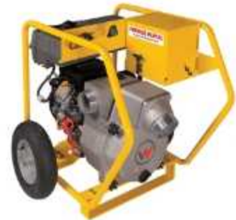
MOTOBOMBA A GASOLINA

Aplicação: Bombeamento de água suja Saída 3" 72 m 3 /h, 4" 156 m 3 /h