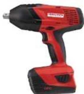
CHAVE DE IMPACTO

Aplicação: Instalações de ar condicionado, eletrocalhas e fixação em concreto Opera com bateria recarregável