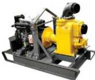
MOTOBOMBA A DIESEL PARA ÁGUA SUJA

Aplicação: Bombeamento de água suja Saída 3" 72 m 3 /h, 4" 156 m 3 /h