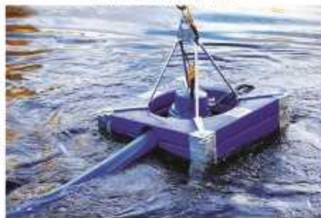
CAPTAÇÃO FLUTUANTE EM POLIETILENO

Aplicação: Serviços de drenagem e abastecimento de água