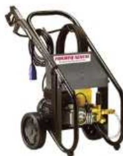
LAVADORA DE ALTA PRESSÃO

Aplicação: Limpeza de fachadas, pátios, obras e condomínios Potência 2600 psi