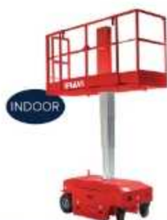
PLATAFORMA LUI 460

Aplicação: Manutenção Industrial, comércio, varejo, hospital e hotéis. Indicada para inventário e trabalho em espaço confinado. Altura de trabalho 6,60 m