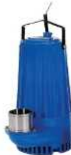
MOTOBOMBA EM INOX

Aplicação: Bombeamento de líquidos ácidos Saída: 3"