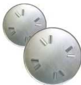
DISCOS DE FLOTAÇÃO

Aplicação: Flotação de concreto em pisos industriais