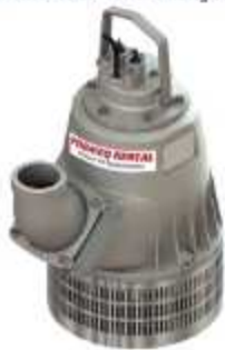
BOMBA PARA GRANDES ELEVAÇÕES

Aplicação: Drenagem em túneis, escavações e minerações Saídas: 3", 4", 6" e 8"