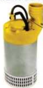
BOMBA PARA CANTEIRO DE OBRAS

Aplicação: Drenagem de obras, fundações e indústrias Saídas: 3", 4", 6" e 8"