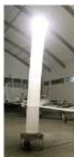
TORRE DE ILUMINAÇÃO

Aplicação: Iluminação de obras e eventos Potência: 1000 w 220 V Gerador 3 Kva