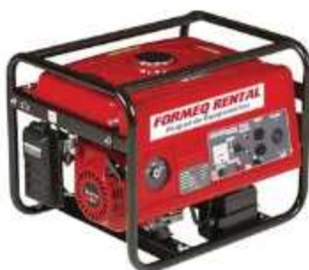
GERADOR A GASOLINA

Aplicação: Fornecimento de energia em 110/220V para obras e eventos Potência: 2,2 à 6,5 Kva