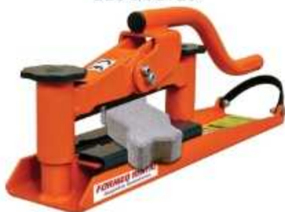
CORTADORA DE BLOQUETES

Aplicação: Serviço de assentamento de pavers (lajotas) Não utiliza energia elétrica