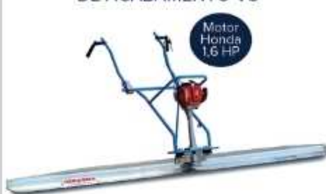
RÉGUA VIBRATÓRIA DE ACABAMENTO VS

Aplicação: Acabamento de pisos em locais confinados sem trilho guia VS2: 2 metros - VS3: 3 metros