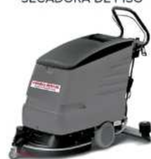
LAVADORA E SECADORA DE PISO

Aplicação: Limpeza de supermercados, indústrias e shoppings centers Produtividade: 1840 m 2 /h