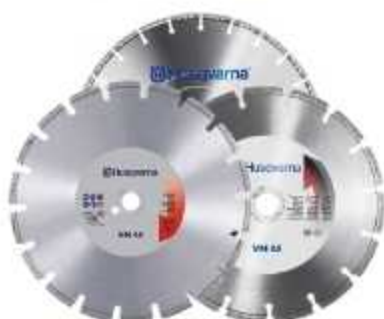
DISCOS DE CORTE

Aplicação: Corte de concreto, asfalto ou porcelanato VN 65: 350/450mm - GS 25: 350mm