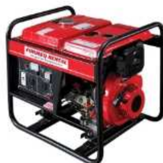
GERADOR A DIESEL

Aplicação: Fornecimento de energia em 110/220 V para vias públicas Potência: 2,2 à 6,5 Kva