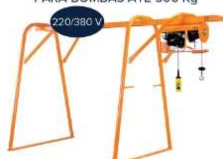
PÓRTICO COM GUINCHO PARA BOMBAS ATÉ 500 Kg

Aplicação: Elevação 30m de cargas em poços de elevador de visita (500 Kg)